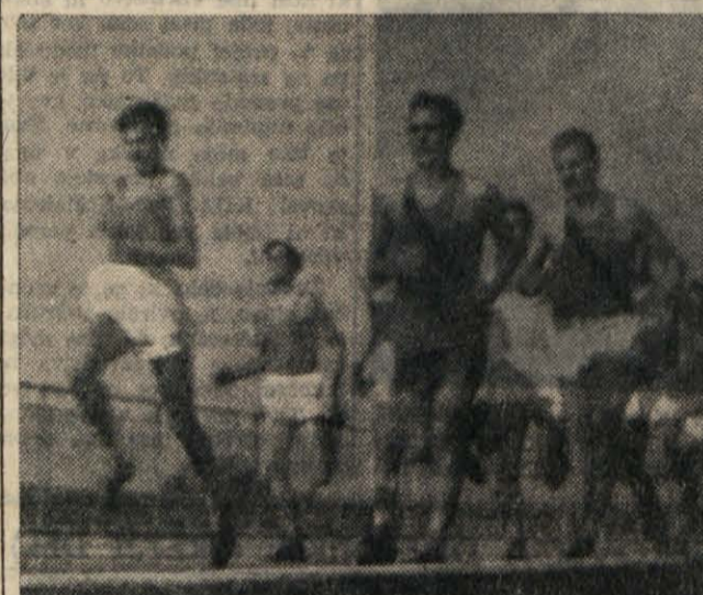
Z LAHKOATLETSKEGA PRVENSTVA V KOPRU, ZGORAJ: TEK NA 800 m. SPODA: START TEKMOVALCEV NA 100 m

V nedeljo se je začelo v Buenos Airesu svetovno prvenstvo v košarki. Jugoslavija, ki je bila v tekmi s Perujem favoriti je morala prepušiti zmago nasprotniku, čeprav je bila tehnično veliko boljša. Čeprav je Jugoslavija prevladovala na igrišču se njeni igralci niso znašli pred košem in so bili zelo nečimri. Peru si je tako priboril prvo zmago z rezultatom 33:27 (18:16).