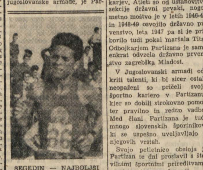
SEGEDIN — NAJBOLEŠI ATLETI «PARTIZAN»

Crpajo svoje člane iz vrst jugoslovanske armade, je Partizan številčno in kvaliteto kmalu prerasel vsa ostala družstva. Tako lep razvoj je bil mogoč predvsem zaradi pravilnega in skladnega dela. Športno društvo Jugoslovanske armade Partizan ima danes 14 sekcij z nad 400 aktivnimi člani. Mnogi med njimi so si priborili naslove državnih prvakov, Izredni so uspehi lahkoatletov, nogometašev in odbojkarjev. Atleti so od ustanovitve sekcije državnih prvaki, nogometno moštvo je v letih 1946-47 in 1948-49 osvojilo državno prvenstvo, leta 1947 pa si je priborilo tudi pokal maršala Tita.