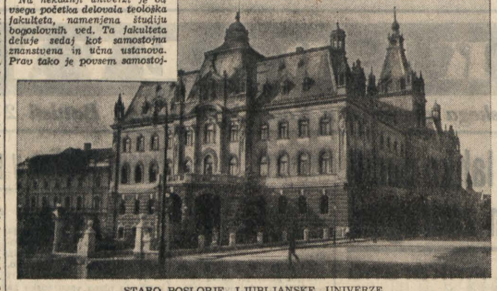
STARO POSLOPJE LJUBLJANSKE UNIVERZE

Zanimati so tudi podatki o številu slušateljev na posameznih fakultetah. V zimskem semestru lanskega šolskega leta je bilo na vseh fakultetah, ki so bile tedaj združene v okviru univerze, skupno vpisanih 4779 slušateljev, od tega 1386 žensk. Najmočnejši po številu slušateljev je bila tehnična fakulteta s 2015 študenti. Njej sledi medicinska s 740 slušatelji, gozdarska fakulteta s 694, filozofska s 486, prirodoslovno-matematična s 364, agronomsko-gozdarska s 309, juridična s 271 in teološka s 107 slušatelji. Ti podatki imajo nalogo povedati, za katere panoge študija vlada na večji zanimanje in po katerih strokovnih vidih vlada največja potreba. V letošnjem šolskem letu je pričakovati še večje število študentov in dostajajo podatki o vpisovanju kažejo, da bo letos slovensko visoko šolstvo doseglo rekord. Pričakovati je, da bo na vseh slovenskih visokih šolah vpisanih okoli 6000 študentov. V letosnjem semestru je študentov v akademijah in pedagoških visokih šolah študente, ki študirajo farmacijo ali veterino na drugih univerzah, potem vidimo, da imamo Slovenci danes že pravo armado strokovnocev vseh panog in strok, strokovnjakov, ki bodo upoštevi doma v strokovno sposoben in politično zavedne izraževalce politike.