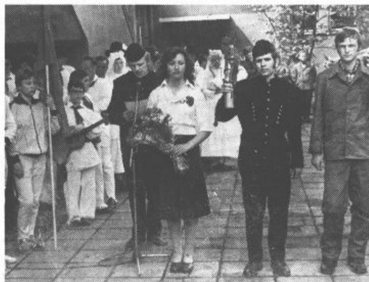
Na Novem jašku je bil že pred prihodom štafete kulturni program, ki so ga izvajali člani Šaleške folklorne skupine in tamburaši iz Pesja ter recitatorji