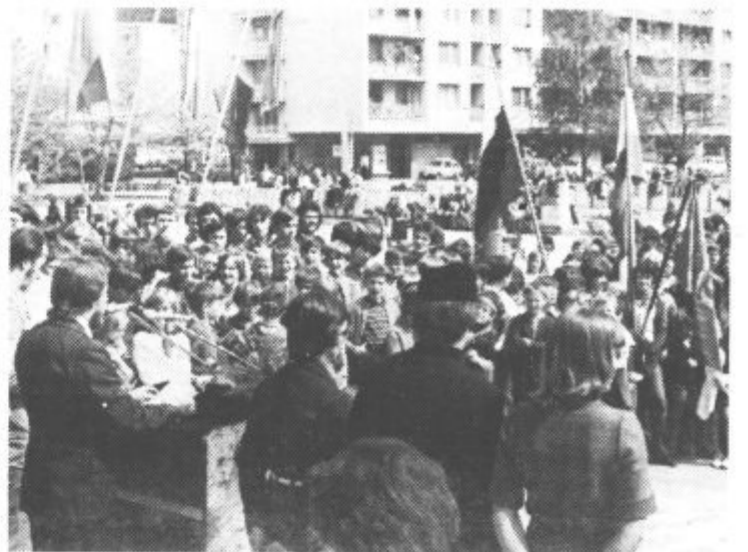
V srcih vseh mladih in drugih občanov, ki so v torek popoldne napolnili ploščad pred kulturnim domom, je bila samo ena želja: da bi bil dolgo, dragi tovariš Tito, na čelu naše samoupravne socialistične domovine.