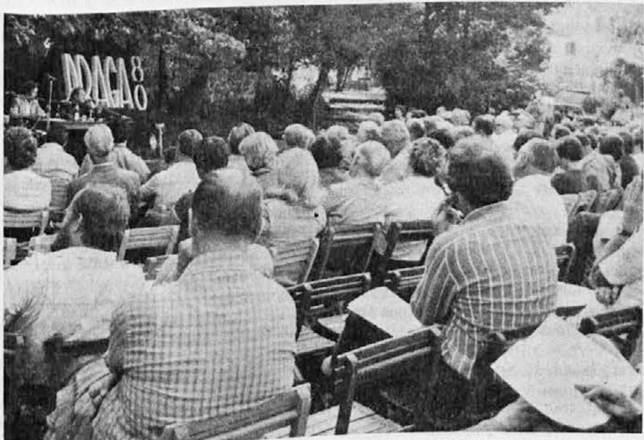
»Draga 1980«: sobotni večer 30. avgusta na vrtu »Finžgarjevega doma« na Opčinah

Na Opčinah pri Trstu bo v nedeljo 14. septembra