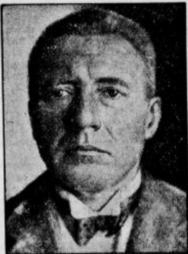
Nemški učenjak Viljem Filchner, o katerem smo včeraj poročali, da so ga kitajske oblasti zaprle.

Poleg drugih znakov mora angleški kralj na dan svojega kronanja sprejeti tudi pet mečev. Ti meči so: meč usmiljenja, meč države, meč žrtvovanja, meč časne pravičnosti ter meč večne pravičnosti.