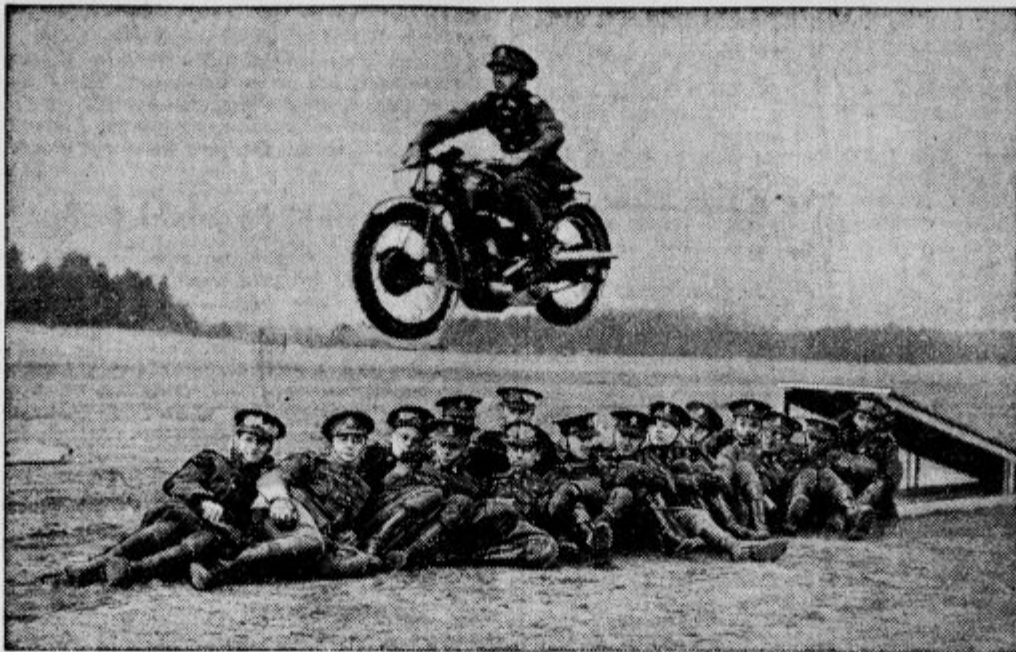
Angleško vojaštvo se pripravlja za kraljevsko kronanje, ko bo vojaštvo priredilo tudi novodobni kraljevski turnir. — Na sliki vidimo motociklista, ki na motorju drveč skoči čez glave svojih vojaških tovarišev.

»Častna straža ključev! Na te besede stopi iz stražnice narednik s 4 možmi straže ter se ponudi za spremstvo. Straža zakliče v te temne, mrzle in obokane prostore: »Kdo tukaj?«