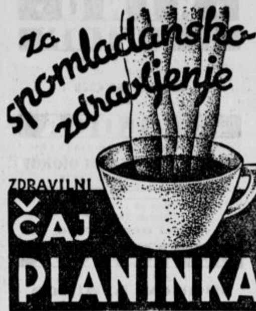
Reg. br. 3007/32.

Koncert se je vršil v zelo številno obiskani francišanski dvorani.