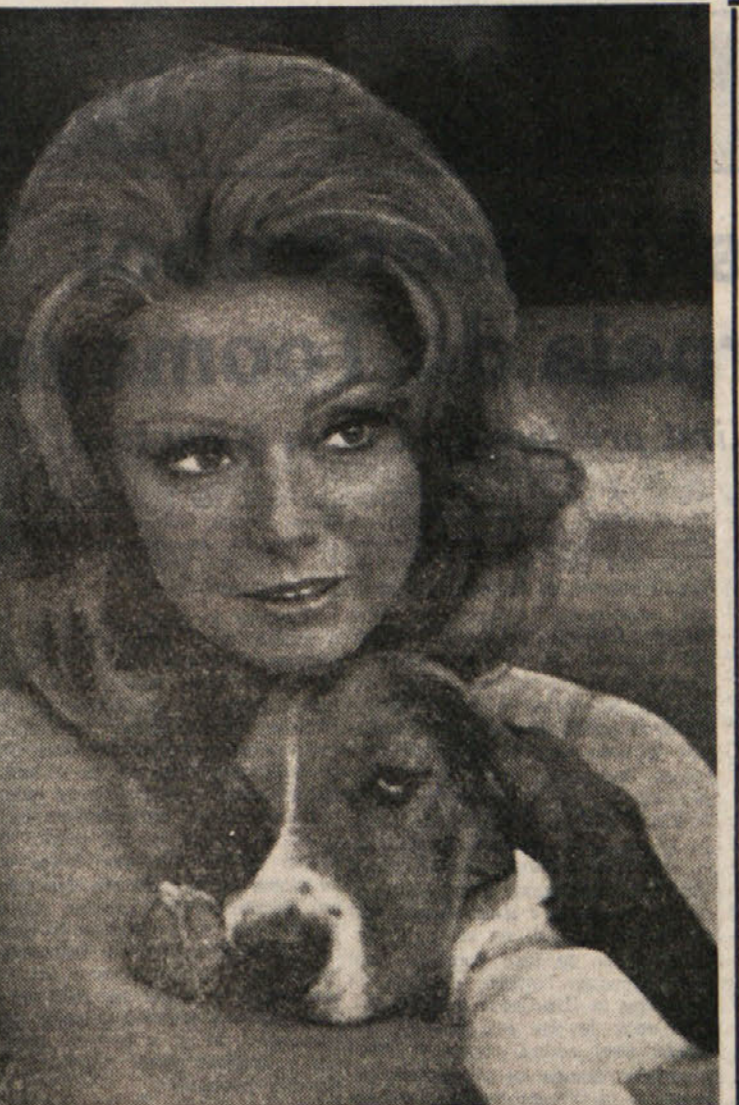
Na sliki vidimo filmsko igralko Silvo Koščičo, ki je zlasti zaslovela s svojo ganljivo vlogo partizanke v filmu «Bitka na Neretvi»...

Pojasnilo v zvezi s «Kotičkom» za mlade V zvezi s «Kotičkom» za mlade bralce so neupravičeno nastali nekateri dvomi.