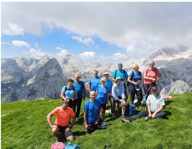
Na vrhu Tosca

po celotnih Julijskih Alpah. Da smo lahko uživali v lepotah naših najvišjih planin, smo morali pred tem v štirih urah premagati dobrih 1000 m nadmorske višine. Ves čas nas je spremljalo lepo sončno vreme. Lahko bi rekli, da smo skoraj bolj trpeli pri vrnitvi, ko je popoldansko sonce kar dobro ogrelo ozračje. Kljub popoldanskim visokim temperaturam in žeji smo varno prispeli na Pokljuko, kjer so