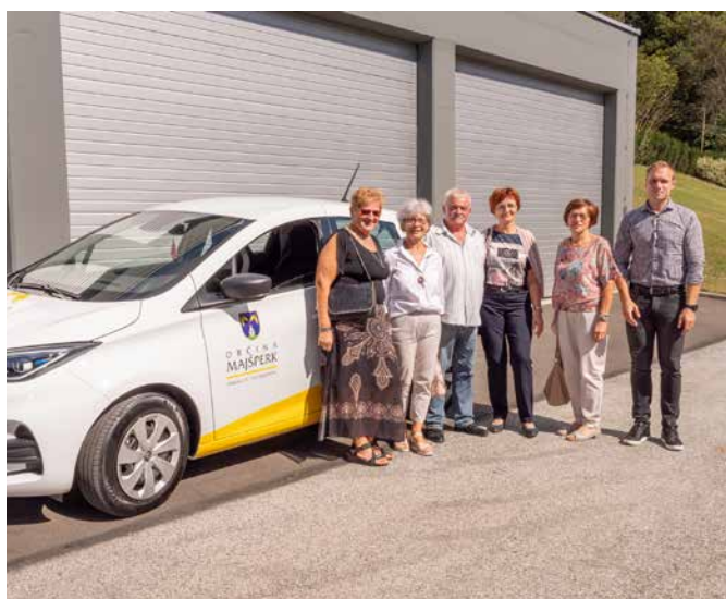
Prostošoferji ob občinskem avtomobilu