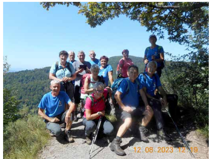
Na Petrovi skali na Bohorju