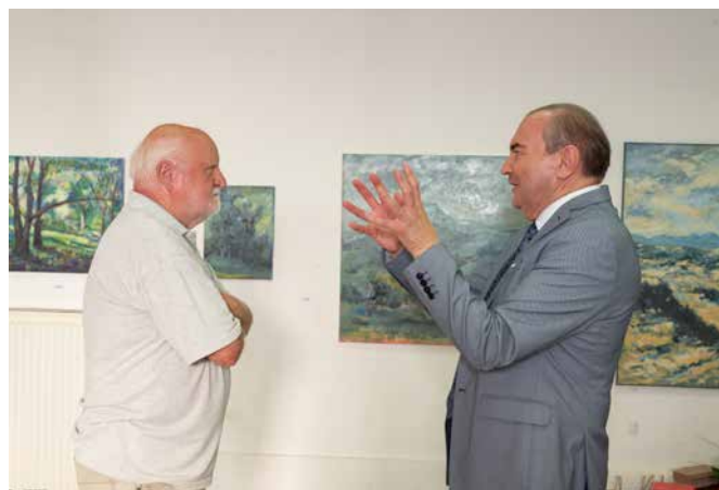
Utrinek z razstave – likovni kritik in slikar v živahnem pogovoru