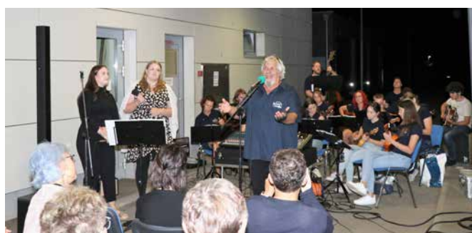
Tamburaške vaje na prostem so privabile poslušalce.

Majšperčan je glasilo Občine Majšperk, ki je tudi izdajatelj glasila. Vpisan v razvid medijev pod zaporedno št. 94. Naslov: Občina Majšperk, Majšperk 39, 2323 Majšperk, tel.: 02 795 08 30, e-naslov: obcina.majšperk@majšperk.si .