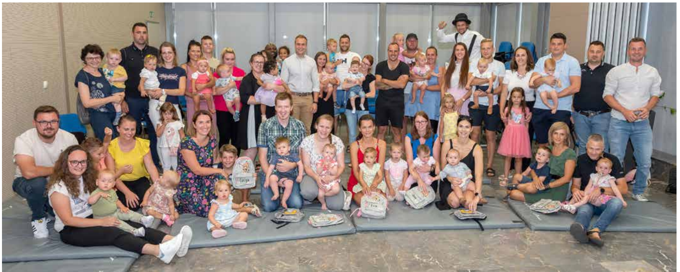
Skupinska fotografija ob sprejemu otrok, rojenih 2022