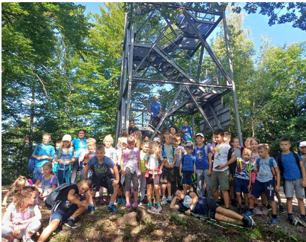
Prvi pohod mladih planincev na Resevno

Avgust je sicer že tradicionalno mesec, ko se priključimo praznovanju občinskega praznika. Tudi letos se nismo izneverili tradiciji in smo v nedeljo, 20. avgusta, pripravili pohod »Spoznamo občino peš«. Letošnja izvedba je bila malce drugačna od