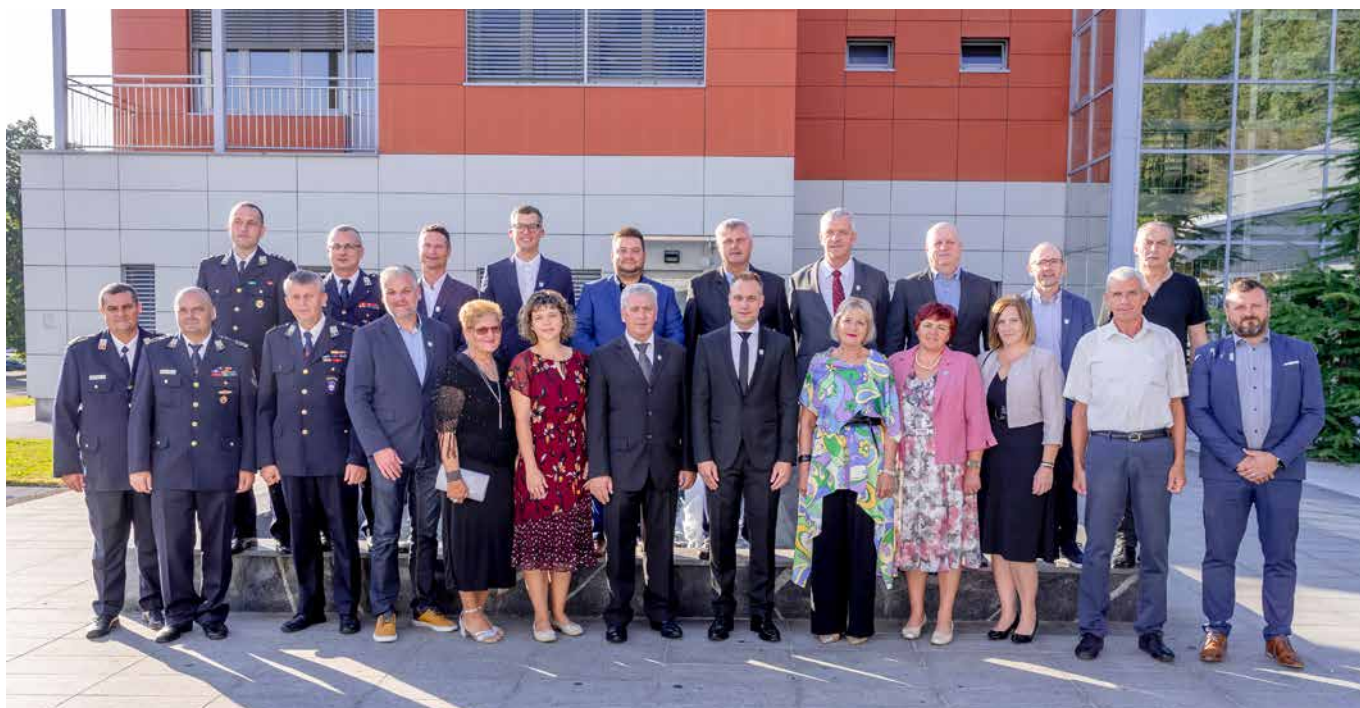
Občinske svetnice in občinski svetniki z županom in dobitniki priznanj ob občinskem prazniku