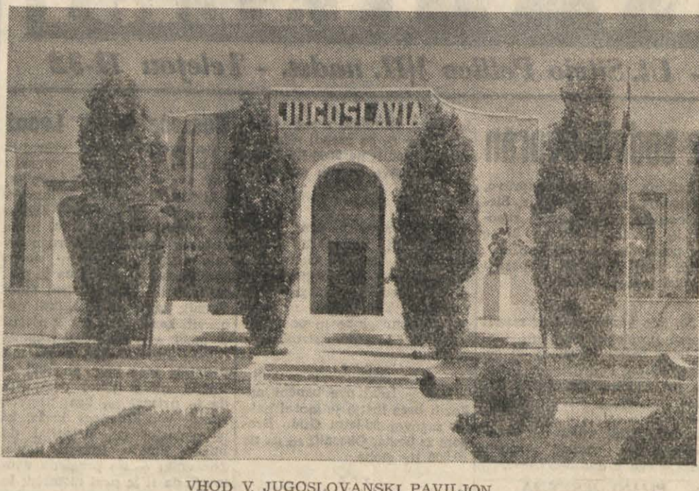
VHOD V JUGOSLOVANSKI PAVILJON