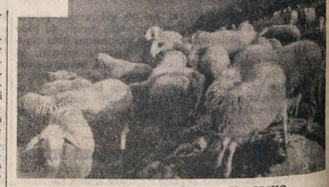
CREDA OVAC SE POMIKA V DOLINO

Do sedaj so pasli le okoli 80 glav. Opaniški, porezenski in sorški pašniki so bogastvo — ker ljudje živijo in ovcam prvostopno pašo.