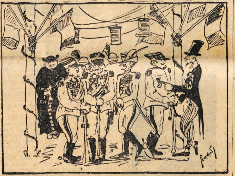
— Cavaliere, vi imate samo eno odlikovanje?! — Da, na žalost med vojno nisem osvajal po Jugoslaviji. (Po »Narodni Armiji«)

Tako so na odprtem partijskem sestanku neparijski spoznali, da je Partija organizacija najbolj predanih in najbolj požrtvovalnih ljudi, ki se dosledno bori za splošni dobrobit vseh ljudi in napredek skupnosti na vsakem koraku. Spoznali so lahko tudi, da Partija v svojih vrstah ne trpi neiskrenih in nepoštenih ljudi. Pr.