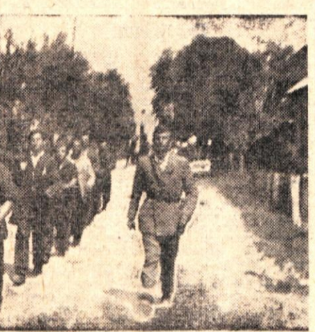
Skozi žabjo vas koraka predhodnica

borci so se zabavale in prepevale partizanske pesmi. Nato so nadaljevale pot v Belo krajino, partizane pa so zvalili v svoje osrčje košati Gorjanci.