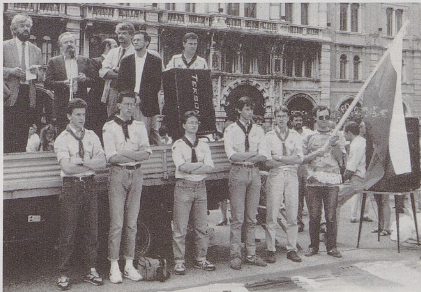
Manifestacija proti vojni in za samostojno Slovenijo na trgu Unità v Trstu: predstavniki SKK in skavtov.