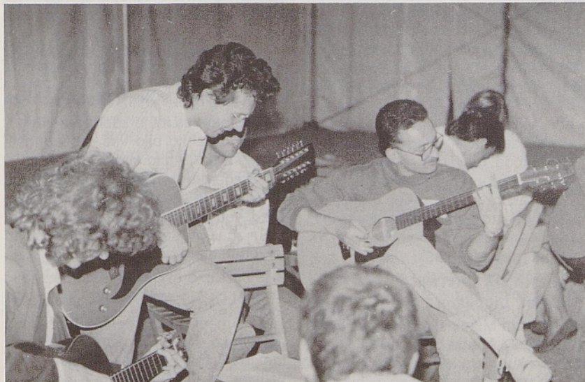
Družabni del Tabora mladih.