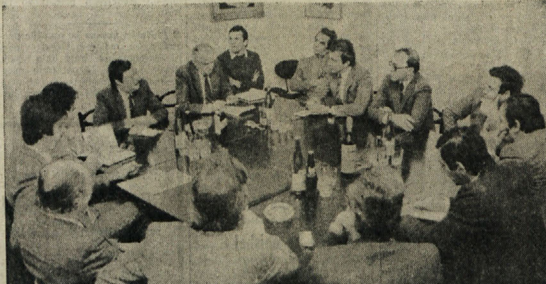
Narodne in študijske knjižnice.