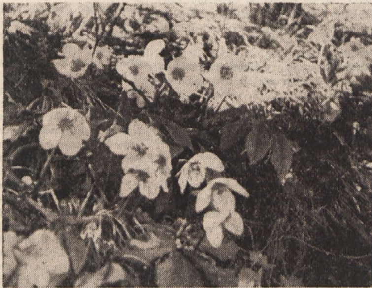
O cvetju je prišla pomlad....

Po obisku v ZDA so se francoski državniki podali še v Kanado in se tudi tam razgovarjali o vprašanjih, ki so v skupnem interesu obeh držav.