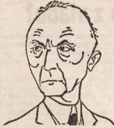
Nemški kancler Adenauer

Čeprav predstavlja ratifikacija neko zmago Adenauerja, pa bo končna usoda evropske obrambne skupnosti le še odvisna od zadržanja francoskega parlamenta in ne nazadnje morda