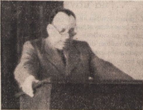
Generalni revizor Splošne zveze podaja revizijsko poročilo

Revizijsko poročilo generalnega revizorja seve ni ostalo le predmet razpravljanja na zadnjih zasledanjih izvršnega ter upravnega in nadzornega odbora Zveze, marveč je tvorilo tudi osrednjo in glavno točko na dnevnem redu tokratnega Zvezinega občnega zbora. Zanimanje za občni zbor je bilo med zadružniki še posebno živo spričo dejstva, da je bilo prvič v