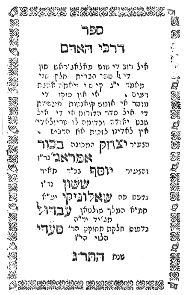
Figura 1: Séfer Darje haadam (Salónica, 1843), portada.

había estado fuertemente inspirada en los contenidos relativos a la ciencia del Séfer haberit (Šmid, 2018, en prensa).