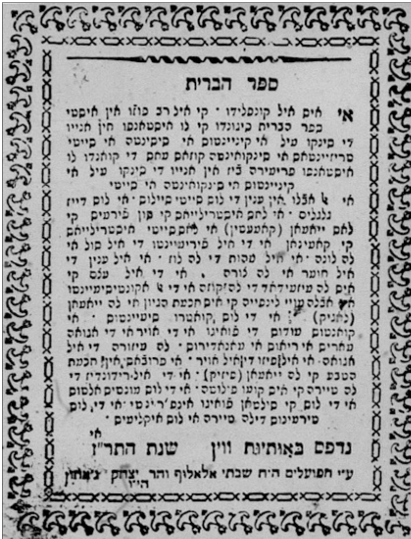
Figura 2: Séfer haberit (Salónica, 1847), portada.

La obra Berajá hamešulšet o Las tres luces volvió a publicarse en Salónica en el mismo año (1881), y más tarde en Constantinopla en 1900, conteniendo solo las obras Séfer haberit (pp. 3–178); Bá'al tešubá (pp. 3–88); y El asolado en la isla (pp. 3–146). Según Lazar (1999, 851), Eliyahu Leví ben Nahmías, editor de la tercera edición, no había conseguido derechos de autor para la publicación de la obra El rijo de la vida (1a–60b), por lo cual probablemente tuvo que ser retirada.