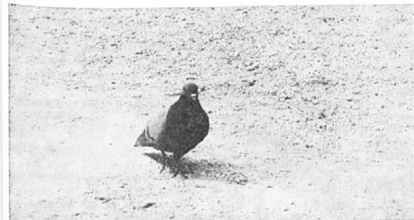
Spomnimo se kaj nanje