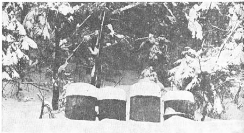
Sneg vse polepša

Kar zadeva bodočo samoupravno organiziranost v železarni Ravne je bilo v poročilu, ki ga je podala komisija za izvedbo ustavnih dopolnil, rečeno, da smo do sedaj že organizirali nove