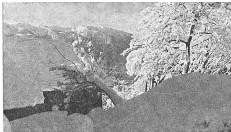
Zima v Sentanelu