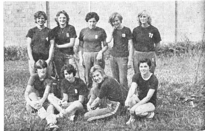
Članice OK Fužinar