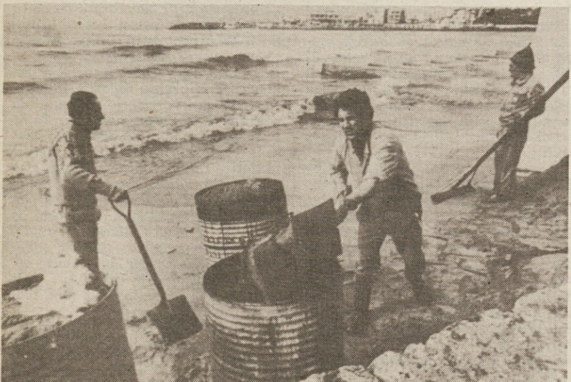
PALMA DE MALLORCA — Skupina delavcev odstranjuje z nafto prepojeni pesek na plaži San Juan de Dios v zalivu Palme de Mallorca na Balearskih otokih