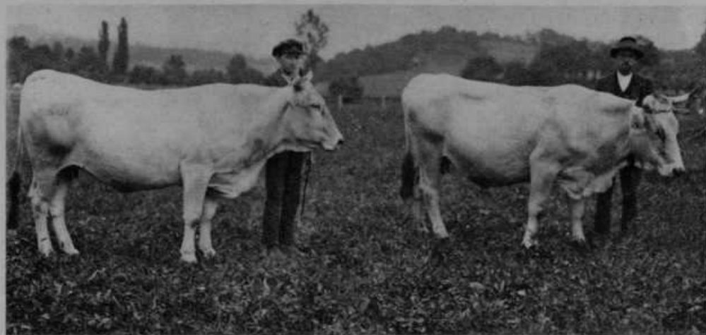
Dve kravi s I. darilom.

šolati, kako skrbeti za zdrav razvoj in napredek živine: tu pridejo v poštev zlasti: dobri hlevi, umna prehrana, pašniki, planine. V tem oziru se bo moral naš kmet še marsikaj novega naučiti. Zakaj tudi tu velja staro pravilo, da je nevednost najdražja stvar na svetu. V tem oziru so razni živinorejski tečajji, predavanja in tudi knjige za kmete neprecenljive vrednosti. Da se pasma, kakršna je za gotove pokrajine v Sloveniji bolj primerna, čim bolj izpopolni in težke napake čim bolj odstranijo, so velikega pomena živinske razstave in premovanja. Na razstavi kmetje vidijo, kaj je dobra živina, pa tudi, kaj je slaba. Dobri rejci dobe nagrado in to je pobuda za druge, da tudi svojo živino skušajo povzdigniti. V najožjem sliku z umno živinorejo je seveda dobro organizirano mlekarstvo, ki baš tvori bistven dohodek pri živini.