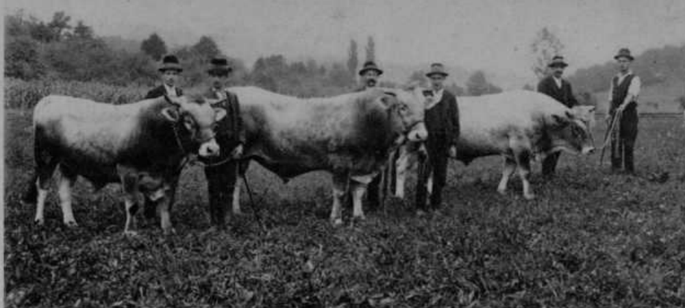
Biki z II. darilom.

šolati, kako skrbeti za zdrav razvoj in napredek živine: tu pridejo v poštev zlasti: dobri hlevi, umna prehrana, pašniki, planine. V tem oziru se bo moral naš kmet še marsikaj novega naučiti. Zakaj tudi tu velja staro pravilo, da je nevednost najdražja stvar na svetu. V tem oziru so razni živinorejski tečajji, predavanja in tudi knjige za kmete neprecenljive vrednosti. Da se pasma, kakršna je za gotove pokrajine v Sloveniji bolj primerna, čim bolj izpopolni in težke napake čim bolj odstranijo, so velikega pomena živinske razstave in premovanja. Na razstavi kmetje vidijo, kaj je dobra živina, pa tudi, kaj je slaba. Dobri rejci dobe nagrado in to je pobuda za druge, da tudi svojo živino skušajo povzdigniti. V najožjem sliku z umno živinorejo je seveda dobro organizirano mlekarstvo, ki baš tvori bistven dohodek pri živini.