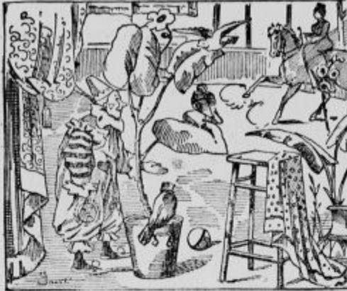
Kje je drugi glumač?