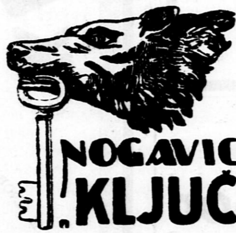
Najboljše, najtrajnejše, zato najcenejše

Najbolj presenetljiva je ugotovitev, da je imela Azija v ledeni dobi veliko sredozemsko morje, od katerega je ostalo samo premikajoče se Lopnorsko jezero. Ekspedicija je našla okamenele kostnjake ogromnih kuščarjev. Ena postranskih ekspedicij je našla na bregu reke Ecingola literaturo iz dobe Han in 50.000 kulturnih predmetov iz mlajše kamnite dobe. Sven Hedin pripoveduje v svoji knjigi o pohodih in običajih prebivalstva, ki je živel v teh krajih pred 5000 leti in je izviralo najbrž iz rodu Sinanthropus Pepinensis. Slavni raziskovalec pravi, da se je prepričal, da je Azija zibelka človeštva.