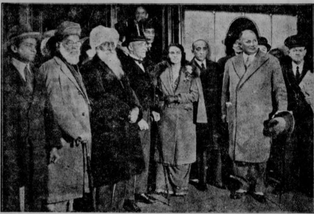
Ob zvršetku pomembne angleško-indijske konference: zastopniki Indije se poslavljajo od Londona in vračajo v svojo domovino.