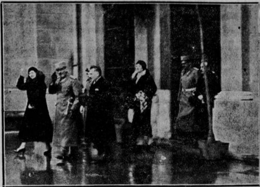
Kraljevska dvojica prihaja iz kolodvora.

160.000 ljudi sprejelo kraljevsko dvojico