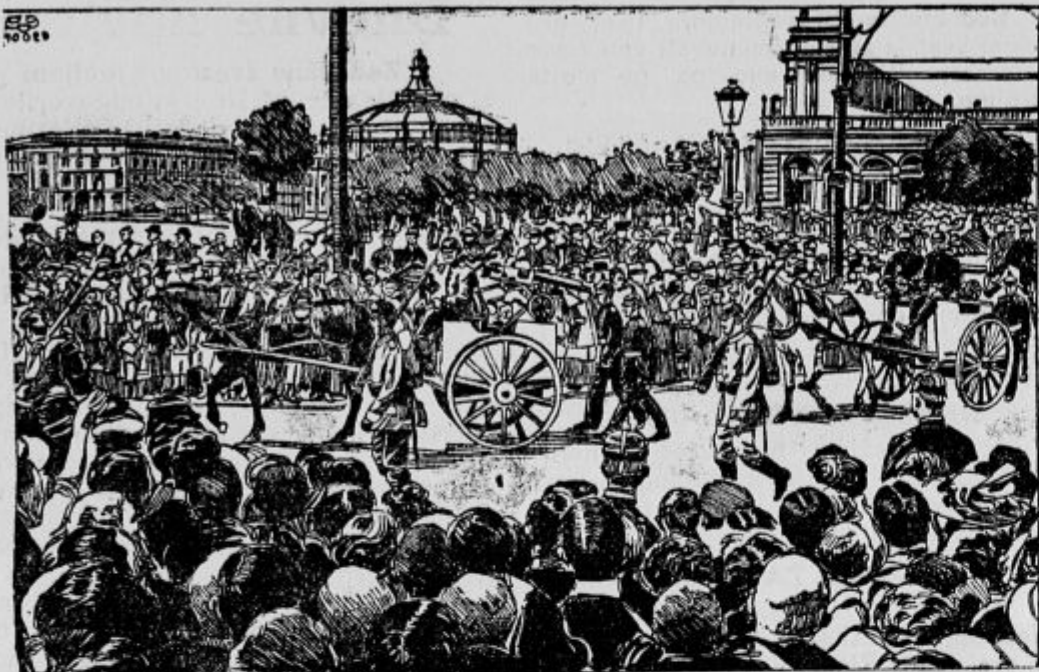
Nemci pripeljejo zaplenjene topove v Berlin.

Solun, 10. septembra. (Kor. urad.) Po v Solun došli poročili so čete bolgarskih vstašev zopet razdrle del železniške proge Gevgeli v Novi Srbiji.