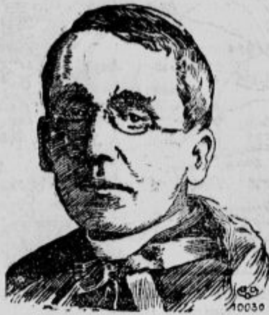
Sv. oče Benedikt XV.

Če jih sprejmejo, dobé dnevno 3 krone odškodnine in prosto hrano.