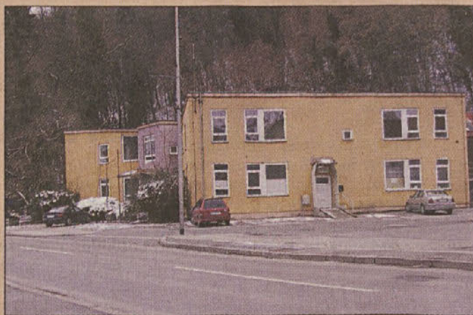
Stari krški zdravstveni dom

Zaradi nezadostnih pobud pa na kadrovskega področju izgublja Posavje. Zunaj regije