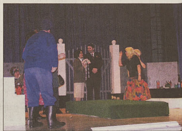
Za sproščeno vzdušje in obilico smeha na prireditvi so poskrbeli igralci DKD Svoboda Senovo s Partljičevo komedijo Nasvidenje nad zvezdami .