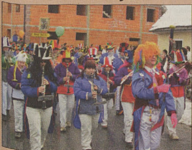
V Kostanjevici na Krki se je preteklo nedeljo s pustno budnico začela Šelmarija. Popoldne so še oklicali kurenta in pripravili pustno povorko po mestnih ulicah (na fotografiji).