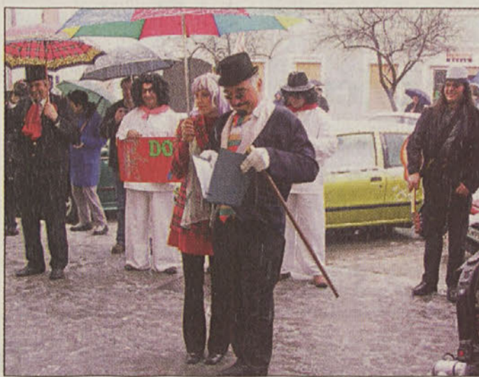
Dobovski fašjenk napoveduje prevzem oblasti.

tradicionalni pustni karneval z mednarodno udeležbo. B.D.