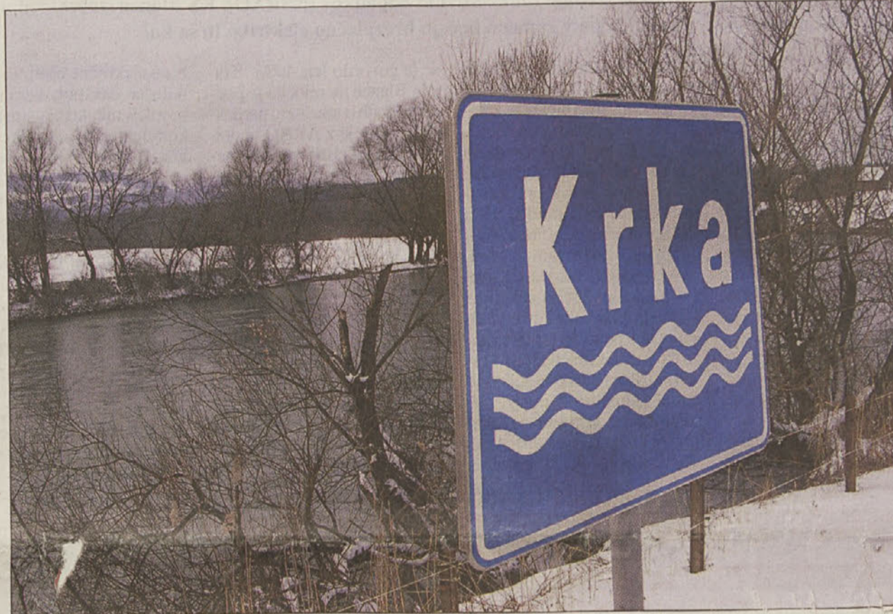
...na strani 3 V Krki zaenkrat plavajo še neokuženi labodi in race.

Slovenija, Posavje – Potem ko so bili potrjeni prvi pozitivni rezultati referenčnih laboratorijev v Italiji in Veliki Britaniji, da imamo v Sloveniji ptice okužene tudi z najbolj nevarnim virusom H5N1, je Veterinarska uprava celo državo razglasila za visoko tvegano območje. Takoj je uvedla temu primerne ukrepe; na ogroženem območju, kjer so bili najdeni okuženi ptiči, zaščitni pas, sicer pa velja, da mora perutnina živeti, spati, jesti in piti v zaprtih prostorih. Upoštevanje ukrepov nadzirajo inšpektorji in kršitelje kaznujejo. Simptom obolezlosti je hiter množičen pogin v reji, mrtvih divjih ptic se nikakor ne smemo dotikati, vsem prebivalcem RS odsvetujejo sprehode ob vodah.