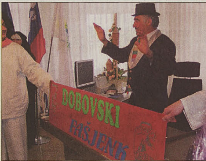
Prekaljeni pustni župan se je "naselil" v pisarni brežiškega župana.