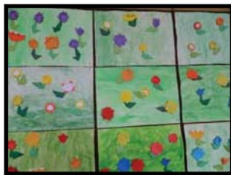
Učenci 2. a-razreda OŠ Borisa Kidriča Kidričevo