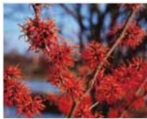
Sliki prikazujeta Zvito lesko levo in Nepozebo (Hamamelis) desno.

Sonce s svojim toplim objemom privabi izpod listja prve pomladne cvetlice. Tako se izpod grmov Hamamelisa na pogled pokažejo telohi v vsej svoji lepoti. Po travnikih in gozdovih se razprostirajo preproge belih zvončkov in po obronkih iz trave sramežljivo pokukajo vijolice in nežne rumene cvetlice – trobentice. Takšne, kot so jih poznale že naše babice, so obogatile hibridne vrste, ki se odražajo v vseh mogočih barvah in tudi oblikah. Razveseljujejo nas na vsakem koraku, ob vhodu, na terasah, v gredicah in v dnevni sobi.