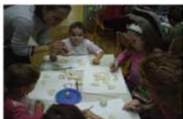
Izdelovanje okrasov za novoletno jelko

Konec leta je čas, ko se tako v vrtcu kot doma veliko dogaja. Za otroke, predvsem mlajše, je ta čas nekaj posebnega, pravljičnega, saj jih obiščejo kar trije dobri možje, ki jih obdarijo. V vrtcu otroke obišče dedek Mraz, ki z njimi preživi dopoldan. Otrokom prinese darila za celo skupino, da se lahko igrajo vsi. Hkrati se učijo deliti in skupaj igrati. Že na začetku šolskega leta smo se dogovorili, da potrebujemo za kakovostno delo nove televizije. Ker ni denarja, smo se dogovorili, da bomo zbirali papir, in starši so nam pridno pomagali. Denar, ki smo ga dobili od papirja, smo namenili za novi TV. Zbirali smo tudi donacije in tako nam je uspelo, da smo kupili dve veliki LCD-televiziji; eno za vrtec Kidričevo in eno za vrtec Cirkovce. Dedek Mraz jim je prinesel tudi koše za ločeno zbiranje odpadkov za vsako igralnico, kar smo potrebovali, saj smo v ekoprojektu, kjer imamo poudarek na ločenem zbiranju odpadkov. Seveda ni manjkalo sladkarij in piškotov, ki so jih otroci sami naredili s svojimi vzgojiteljicami. Tako smo vsi zadovoljni vstopili v novo leto.