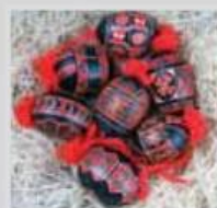
Belokranjske pisanice

Takšna tehnika barvanja pisanic je bila zame velik izziv, sploh po skromnih navodilih, ki sem jih dobila zraven pisalke. Zato ti preostane le samo učenje in izkušnje pri uporabi batik tehnike ali pa nasveti katerega izmed izdelovalcev belokranjskih pisanic – Nade Cvitkovič, ki vsako leto okoli velike noči predstavi