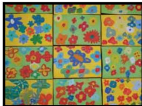
Učenci 2. b-razreda OŠ Borisa Kidriča Kidričevo