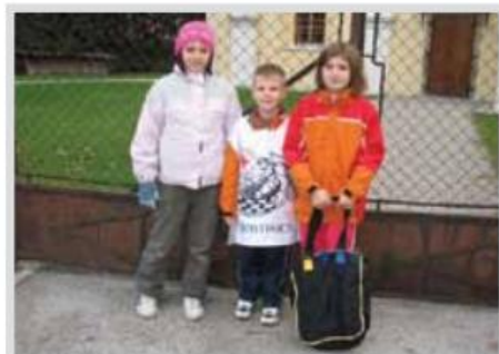
DROBTINICA, Svetovni dan hrane (izkupiček gre za kosila socialno šibkih šolarjev).