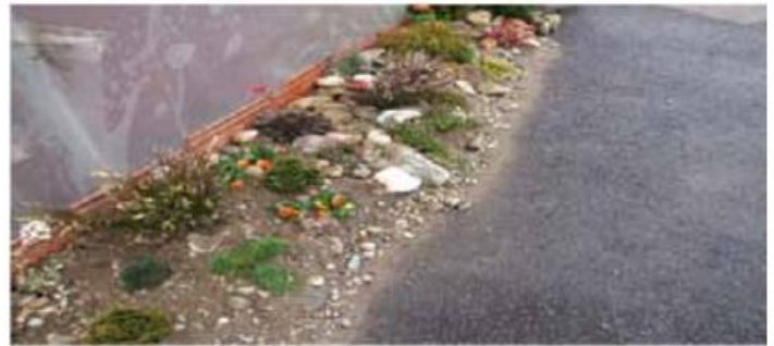
Slika prikazuje vzorec moderne gredice, ki se lahko poljubno dopolnjuje in po želji spreminja.

cami, lahko so obogatene s skupinami enoletnic, ki poživijo posamezne točke gredice. Zasute so s kamni oz. z lujem, kar je bolj prilagojeno okolju. Takšne gredice so seveda ob vzpetinah lahko podkrepjene s kamni. Kamne prekrivajo velikonočnice, trave, planinke in ostale cvetlice, ki potrebujejo malo vlage in veliko sonca. Nega teh rastlin je preprosta, saj potrebujejo striženje po potrebi (grmovnice po cvetenju), enoletnice pa zamenjavo z novimi, tako da je sklop vedno popoln.