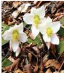
Trobentice, takšne, kot so jih poznale naše babice, pa vse do hibridnih sort in spomladnega teloha.