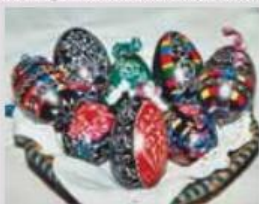
Prekmurske remenke

rdeča, črna barva, tako kot pri belokranjskih pisanicah, ter tudi druge barve. Za tiste, ki bi se prav tako želeli preizkusiti v barvanju