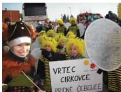
Pust v Cirkovcah

dan, 8. februar, namenili knjigi in brani besedi. Obiskali smo šolski knjižnici, ki sta mnogo večji od naše. Glede na sposobnost otrok so v knjižnicah pripravili posebne vsebine. Sposodili so si knjige, ki so jih brali in listali v igralnicah. Vsaka igralnica ima tudi knjižni kotiček, ki pa je manj založen in vanj prinašajo knjige tudi od doma. Po kulturnem tednu smo se že pridno pripravljali na pust. Starejši oddelki iz obeh enot so bili oblečeni v enotne kostume, ki so jih šivale pomočnice. V Kidričevem so bile »sončnice«, v Cirkovcah pa »čebelice«. Ti so se udeležili povork: otroške maškarade na Ptuj in »cirkovškega fašenka«. Tu sta obe skupini prejeli nagrado.