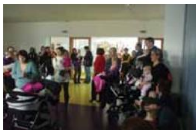
Obisk staršev s svojimi otroki

Končno je zapadel tudi sneg in lahko smo izpeljali smučarski tečaj na Pohorju. Udeležilo se ga je kar veliko otrok, ki vrtec obiskujejo zadnje leto. Izvajal ga je »Smučarski klub Branik«. Vsi otroci so osvojili osnove smučanja. Zadnji dan je bila tekma in veliko staršev je prišlo gledat svoje otroke. Otroci so za prevoženo progo, na kateri so jih spodbujali starši, prejeli pokal. Otroci in starši so bili zadovoljni. Ob koncu januarja so nas obiskali starši z otroki, ki so se rodili v letu 2011 in bodo nekateri že letos z novim šolskim letom prišli k nam v vrtec. Razkazali smo jim vrtec in pogledali so si lahko dejavnosti, ki so se takrat odvijale. Naš pevski zborček jim je zapel nekaj pesmic za dobrodošlico. Zelo jim je bilo všeč, seveda so jih najbolj zanimale jasli. Bilo jih je veliko, tako da bomo imeli v novem šolskem letu zopet poln vrtec. V tem šolskem letu izvajamo projekt »NMK – naša mala knjižnica«, zato smo teden, v katerem je bil kulturni