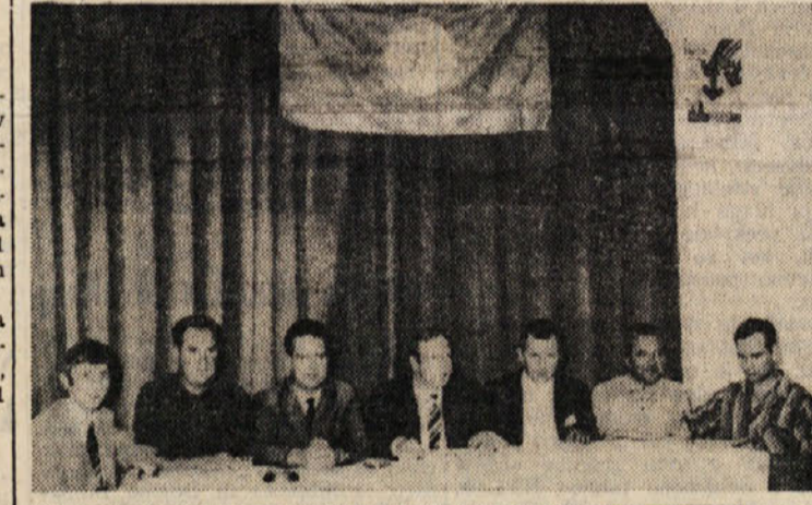
Z občnega zbora Brega: predsedstvo zbora (zgoraj) novoizvoljeni odbor (spodaj)