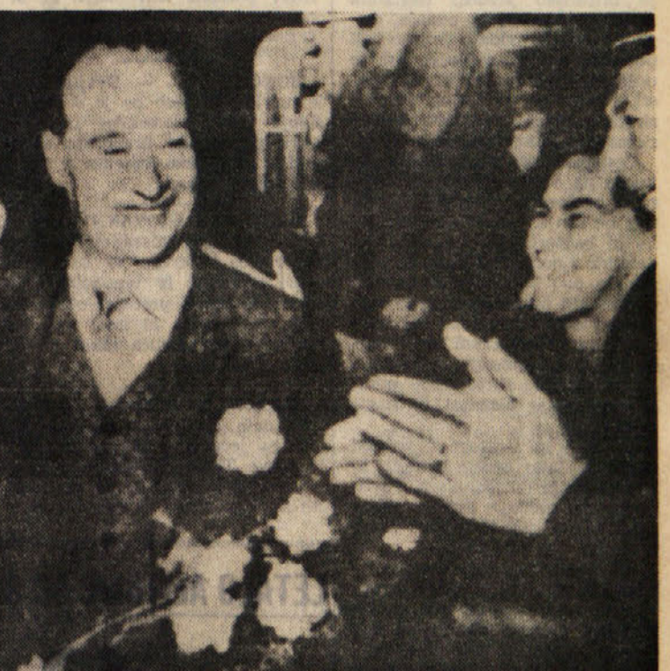
Dubček po razgovoru s sovjetskimi predstavniki v Košicah