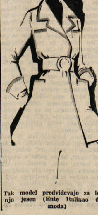
Tak model predvidevajo za letošnjo jesen (Ente Italiano della moda)

nudili prvo pomoč in jih odslovili. Iz civilne bolnišnice so javili, da je v zdravniški osekbi 19 otrok, 19 deklic pa so po zdravniški negi odvožnjo neprilicavano vnel. Plameni so bliskovito zajeli vse sedeže, sofer je nemudoma ustavil gorčevo vozilo in priskočil, kolikor je pač zaradi gostega dima mogel, na pomoč mladim potnicam. Večina teh se je rešilo, tri deklice in njihova spremljevalka, ki bi jih nadzorovala v koloniji, pa so umrle. Kvestura iz Beneventa je kasneje javila, da je bilo 23 otrok več ali manj opečenih. Edino neki osemletni deček je v smrtni nevarnosti, medtem ko stanje ostalih otrok ni resno. Nekaterim so samo