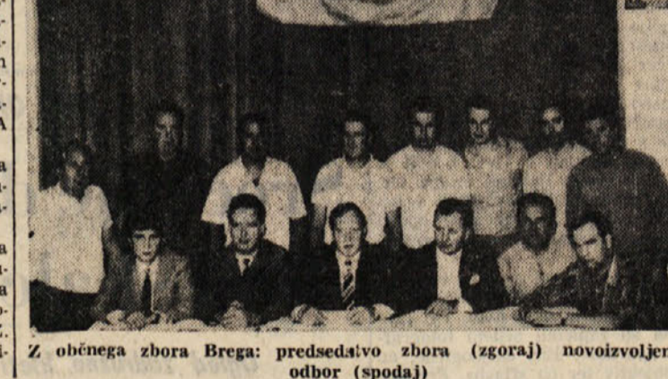
Z občnega zbora Brega: predsedstvo zbora (zgoraj) novoizvoljeni odbor (spodaj)