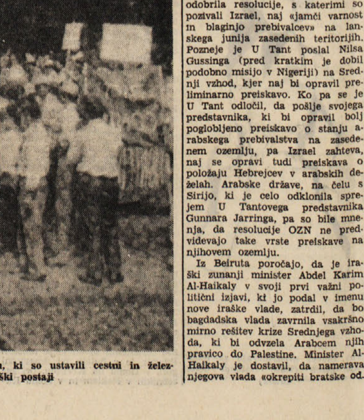
Meštari je stavkalo okrog 10.000 uslužbencev podjetja Montedison, ki so ustavili cestni in železniški promet. Na sliki stavkajoči na železniški postaji

Agencija Tanjug poroča iz Vzhodne Berlina, da so vsi listi danes objavili uradno sporočilo o zaključku razgovorov v Čierni. Niso objavili nobenih komentarjev, vendar pa pada v oči, da so vzhodnemški listi prenehali z ostrejšimi napadi na ČSSR. Vzhodnonemški tisk še nadalje objavlja razne vesti iz Zapadne Nemčije, s čimer skuša dokazati zlonamerne napore za izkoriščanje sedanjih prilik v ČSSR.