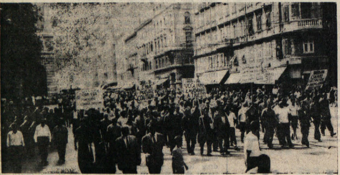
Povorka stavkajočih delavcev v Ulici Carducci

Tajnik FIOM-CGIL Burlo je v govoru poudaril, da bodo delavci zasedli ladjedelnico Sv. Marka in druge tovarne, če si bo kdo upal sprejeti ukrepe v njihovo škodo