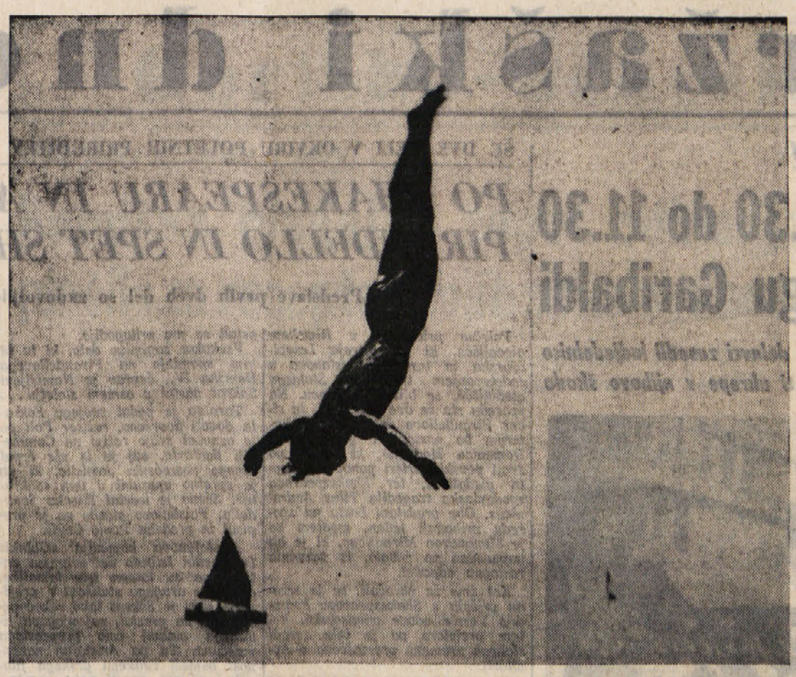
Poletna skladnost med naravnim elementom morja in človeškega telesa. Ni večjega užitka kot pogled na takšen skok v vodo drznega mladega fanta.

Ustanovitev federacije tudi ni potekala gladko, že v samem začetku so prišli do izraza tradicionalna nasprotstva med posameznimi vladarji, individualizem, razdelitev na klane, sistem familiarne in plemenske vladavine. Vse to predstavlja velikanske ovire za razvoj federacije. In prav mnogi opazovalci oziroma poznavalci razmer v tem predelu arabskega sveta z dokajšnjo negotovostjo gledajo na samo prihodnost federacije. Pri tem opozarjamo tudi na resen pritisk ter tuja vmešavanja, ki že od samega začetka ogrožata temelje te teoretično še ustanovljene, toda praktično še nepreizkušene federacije.