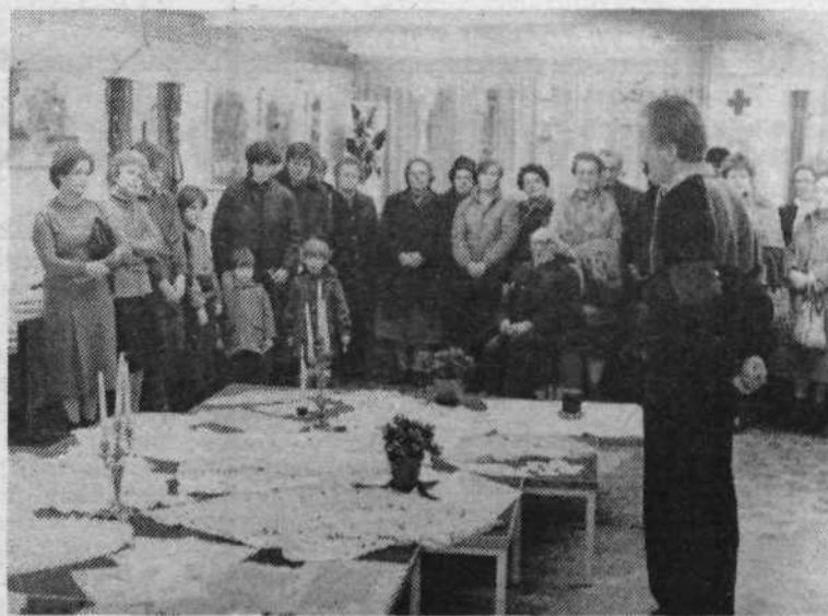
Krajanke KS Stari Vodmat so priredile ob dnevu žena že kar tradicionalno razstavo ročnih del. Prikazani so rezultati večmesečnega zavzetega in natančnega dela. S cvetličnimi aranžmaji jim je priskočila na pomoč cvetličarna Rotovž. Na sliki: Z otvoritve razstave v torek, 5. marca.

V Foto Tivoli nimajo veliko »prijateljev« med zasebnimi fotografi. Ker z uvajanjem proizvodnih izboljšav znižujejo proizvodne stroške, ne hitijo s podražitvami storitev tako, kot izdelovalci kemikalij in fotopapirja. Razmeroma nizke cene barvnih fotografij pa že postajajo trn v peti zasebnikom.