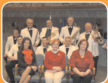
PARLAMENT DIXIE BAND

Naši pobudi se vsako leto pridružijo stari in novi podporniki. Letos akcijo pričenjamo v Mariboru, zadnji dan prvega pomladnega meseca. V posebno radost nam je, da so se nam pridružili glasbeniki Parlament dixie banda; v podporo pričetku akcije so posneli nov CD plošček. Pomežikovim podpornikom, obiskovalcem dobrodelnega koncerta, bo CD na voljo po posebno ugodnih cenah.