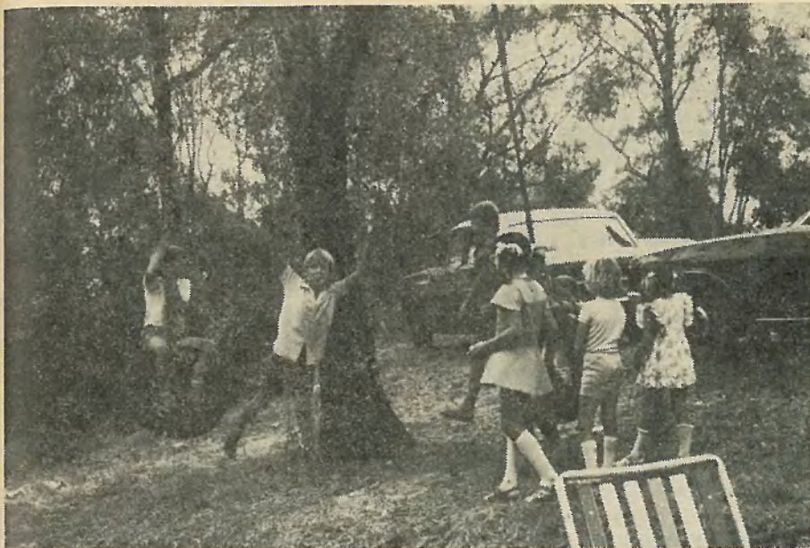
Naš hrib v Elthamu ima tudi za naš naraščaj že sedaj dosti privlačnosti — še več pa jo bo v bodočnosti