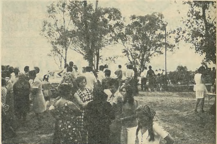
Veselo kramljanje na prvem članskem pikniku na našem hribu v Elthamu

Obiskovalci so pokazali veliko zanimanje za načrte in bilo je mnogo koment-