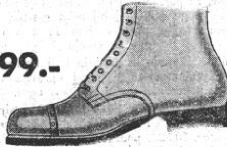
Vrsta 3701 za

Udobni čevlji iz črnega boksa z netaztrgljivim gumijastim podplatom. Zelo prikladni za tiste, ki so pri svojem delu prisiljeni, da veliko hodijo.