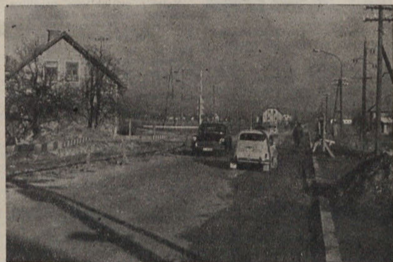
V zadnjem času je bilo na Šmartinski cesti precej nesreč, kdo je temu kriv? Tudi izvajalci rekonstrukcijskih del so deloma krivi, saj začeta dela nadaljujejo s polzevo hitrostjo

OB DELAVSKEM PRAZNIKU 1. MAJU, ČESTITA UREDNIŠTVO MOŠČANSKE SKUPNOSTI VSEM BRALCEM IN SODELAVCEM