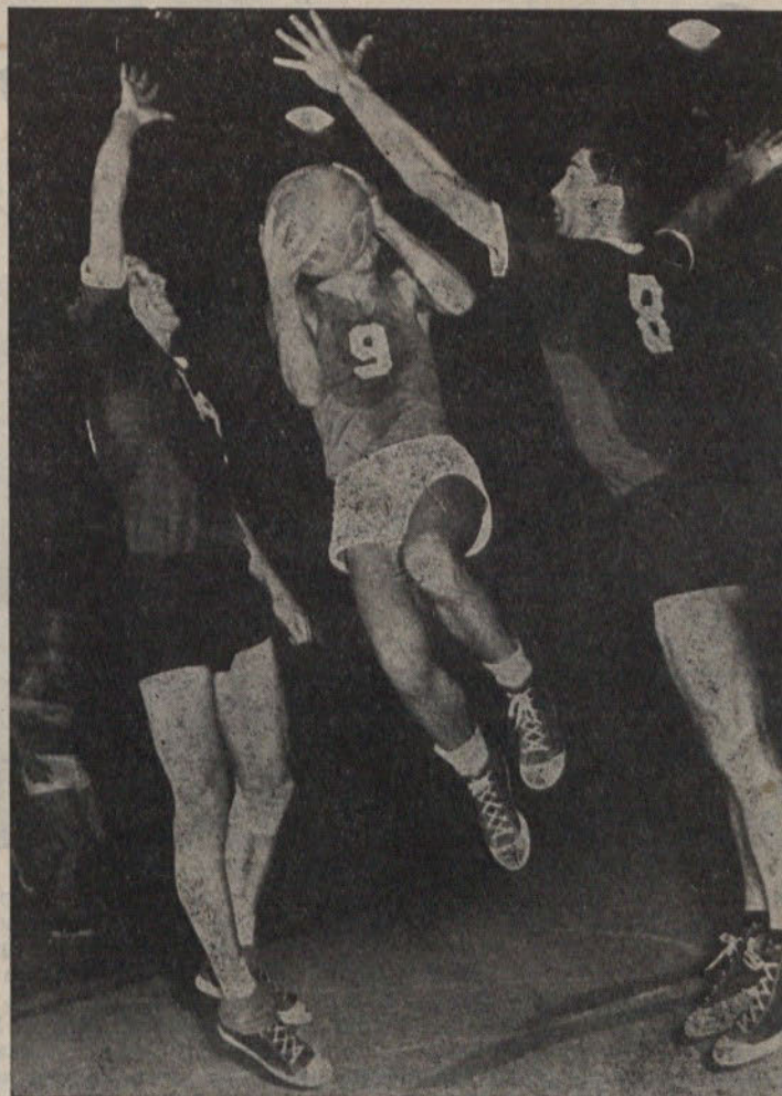
Košarkarji Slovana so odlično štartali v hrvatsko-slovenski ligi. Premagali so Radničkoga v Sl. Brodu in bivšega zveznega ligaša Ljubljano. Svoje sposobnosti bodo Slovanci 30. aprila preizkusili v prijateljski tekmi proti znanemu moštvu Ignis iz Italije.

Vloga in naloge telesne kulture tudi v naši občini sta na pragu nove poti. Telesno kulturo je treba čimprej približati našemu delovnemu človeku in slehernemu občanu.