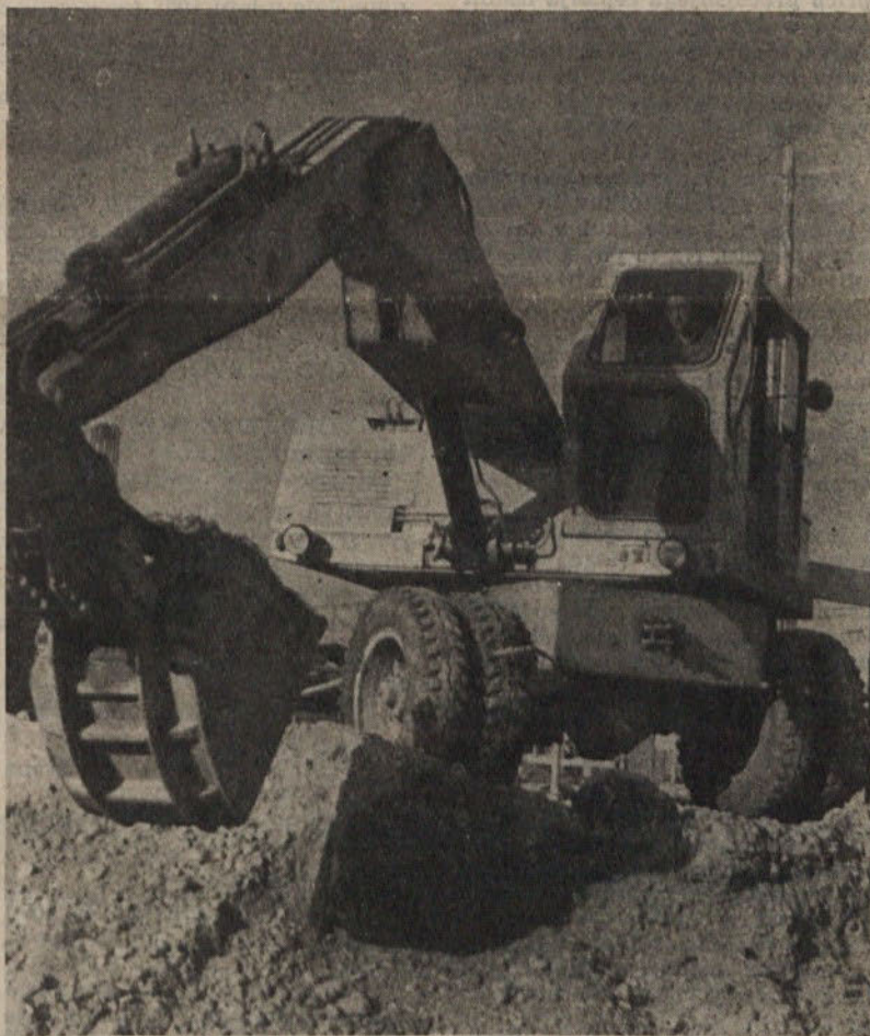
Na številnih novih gradbiščih v naši občini so buldožerji zarili svoje jeklene čeljusti v zemljo in pripravljajo temelje indust. objektom

bivalstva v letu 1961 bo naraslo za približno 3,2 odstotka ali za okoli 1.000 prebivalcev, število na novo zaposlenih pa za 8,5 odstotka ali za okoli 750 delavcev. (Nadaljevanje na 2. strani)