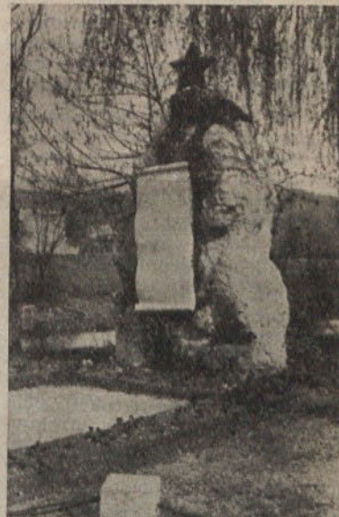
Spomenik žrtvam pred Papirnico Vevče

kolektivih naše občine organizirali lastne prireditve, na katerih bo sodelovalo kar največ članov kolektiva.