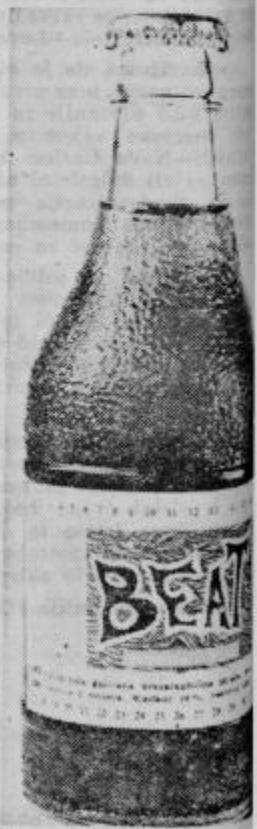
Nova brezalkoholna pijača »BEAT« krepi in osvežuje PETOVIA PTUJ

venije je sklenil, da je o teh stališčih takoj stiti ZIS z zahtevo, da devet nujno ponovno razlga in uvrsti tudi omen odseka pri nas pri mednarodni banki za obnovo razvoj.