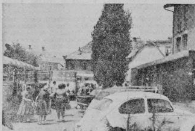
Parkirni prostor pred hotelom je vedno zaseden; nove skupine pravkar izstopajo iz avtobusov. Verjetno grede na vinsko pokušnjo

doma nekje iz okolice Ormoža pri Ormožu sem vprašal, kaj namerava kupiti. Odgovor je bil dobesedno tak, kot vam ga citiram: »Oja, marsikaj bi rabili hiši, marsikaj od tega, vidite tukaj bi morali kupiti, pa kaj, če so tisočaki tak poredki prebivalci naših narnic.« Rade volje sem potrdil njegovim besedam in izgubil iz sejmskega vrveža. Odhajali so tudi mnogi drugi obiskovalci. Kako bi, saj je bil lep sončen dan in doma jih je čakalo delo na polju... J. S.