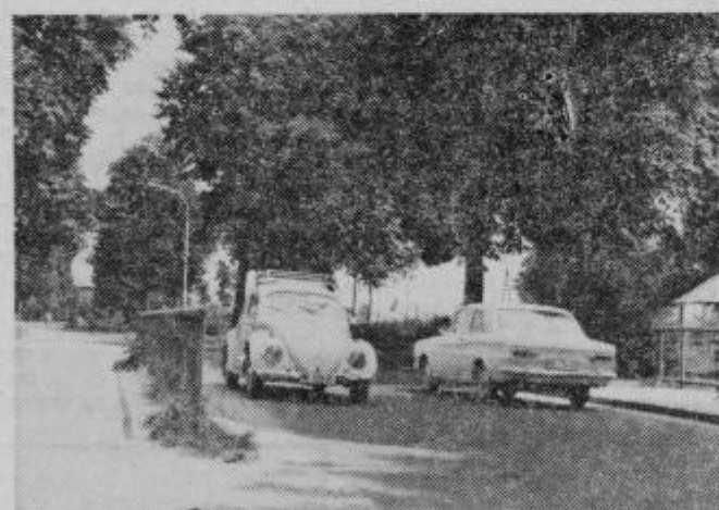
Most s tremi ograjami...