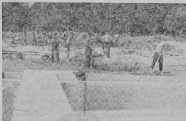
Mladinski delovni živčav ob bazenu v Ormožu »fo Hosto«

Prvi delovni izmeni bo sledila druga izmena prostovoljnih mladih delavcev, ki bodo dobili prihodnje leto, seveda bolj moralno, kot materialno priznanje za opravljeno delo — enomeseč-