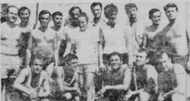
Odbojkarji iz Majšperka, Brega in Desternika po res športnem srečanju v Majšperku

ga, drugo Majšperka, tretji so bili odbojkarji Desternika. Po tekmah so se tekmovalci razveselili na prijetni zakuški, ki so jo pripravili Majšperčani. Ponovno so poudarili, da je treba lanj začeto sodelovanje in tekmovanje nadaljevati. Desterničani so povabili ekipo iz Majšperka in Brega v Desternik. Vabila so se razveselili vsi, posebno še Brežani, ki so lanj v Desterniku po tekmi preživeli čudovito nedeljo. ZR