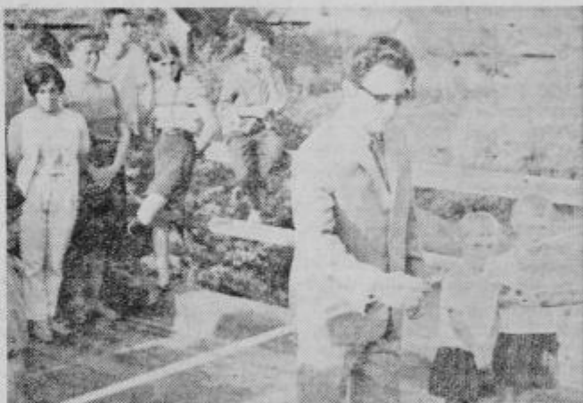
Podpredsednik SO Slovenska Bistrica je svečano predal most njegovemu namenu

Dolgoletna želja Studencičanov je bila tako z izgradnjo mostu izpolnjena. Razen tega pa so dobili most, ki je