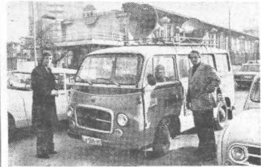
S Pavlihovim kombijem in zvočnikom je naš »spiker« trkal na volilno zavest Šiškarjev