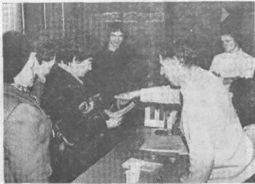
»Tu obkrožite, če ste za!« Izčrpana navodila — manj neveljavnih glasovnic...