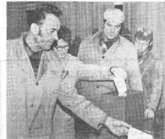
Tudi v Colorju so izvolili delegacijo