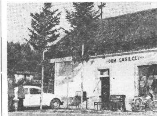
Mlaji pred voliščem, glasba in čudovit dan...