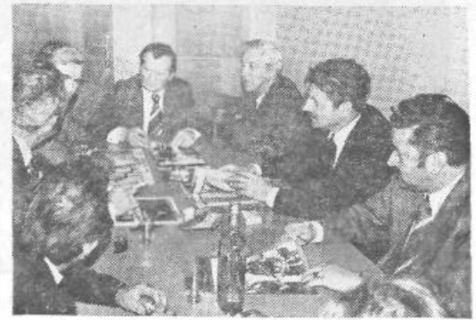
Občinski štab zaseda