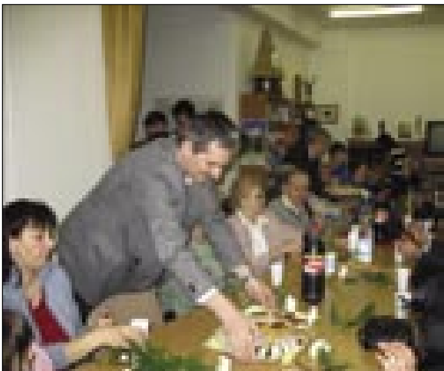
Moški so ponüjali reteše

Tau tō ne pozabite, ka den žensk brez moškov nega. Té svetek vam mi damo. Eške tau vam dopistimo, ka vam frigaš zgori ali pogačice v redlini – zato, ka mujs morete gledati televizi-jo. Gnauk se leko zej – pravimo mi moški. (Včara se je rejsan tak zgodilo.)