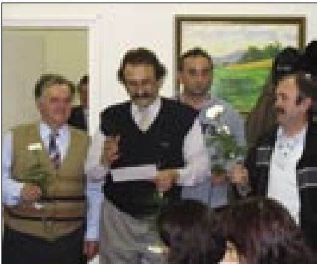
Püšeu moškov z gučom in klinčeci

Den žensk je takši svetek, šteri je samo vaš. Materinski den je več nej za vsakšo žensko. Den že nsk je za najmlajšo »žensko«, štera eške nosi plenice, pa za najstarejšo tō, štera odi s klükavo palico. Za lejpe mlade, štere nosijo na vsakšom prsti po dva zlata prstana. Pa za tiste tō, štere odijo z motkov na plečaj, pa majo žülnato prgišče. Na den žensk si edno raužico pa poljubček, edno lejpo besedo zasluži vsakša ženska.