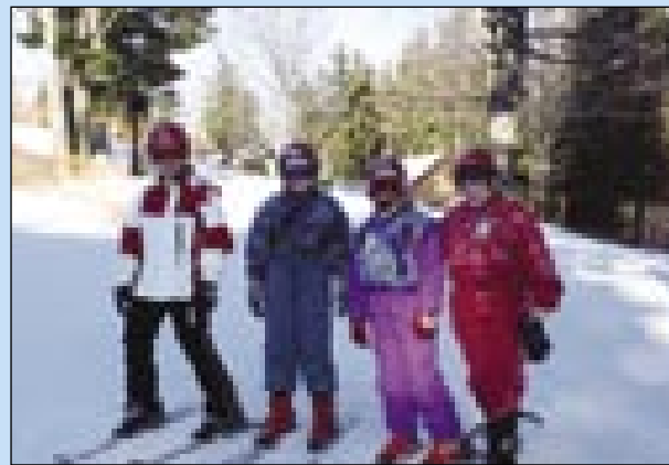
Smo že prave smučarke