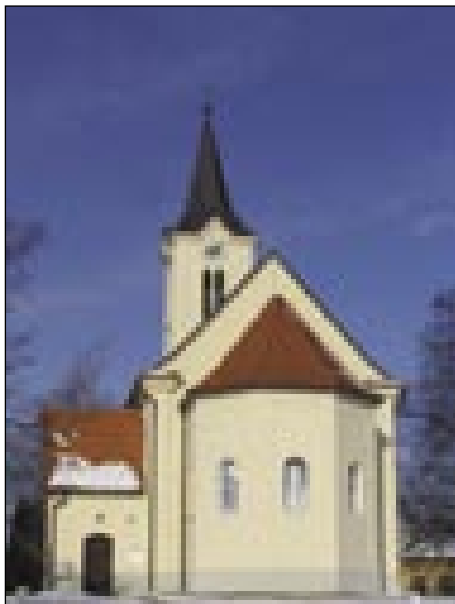
Cerkve sv. Benedikta v Kančevcaj/Bedeniki od vzhoda

Na svejti so kraji, ka so inaič svvetli kak indri. Tak je na bedeničkom brejgi, gde se že rano, znabiti ešče pred drugimi v Slovenskoj okroglini (Tót-ság), guči o ednom klauštri. Daleč nazaj. Čeglij nega nika ekstra o klauštri povedanoga po pisanom spominanji rano, leta 1208, guč o cerkvi sv. Benedikta (... ad ecclesiam sancti Benedicti ). Po zapisanoj pripovedi (Košič) se misli, ka se je opatija pri Bedeniki imenüvala de Borch , tak kak naj bi o njoj leta 1093 poroučo nekši Hartnid iz Radgone. Stau pa naj bi te bedenički klaušter ešče prle, kak je biu kcuj vzeti k Vogrskomi orsagi. Tau je jako rajcig tau naše preminočnosti, ka de ga trbelo globko vözbrediti; pa te kumaj videti,