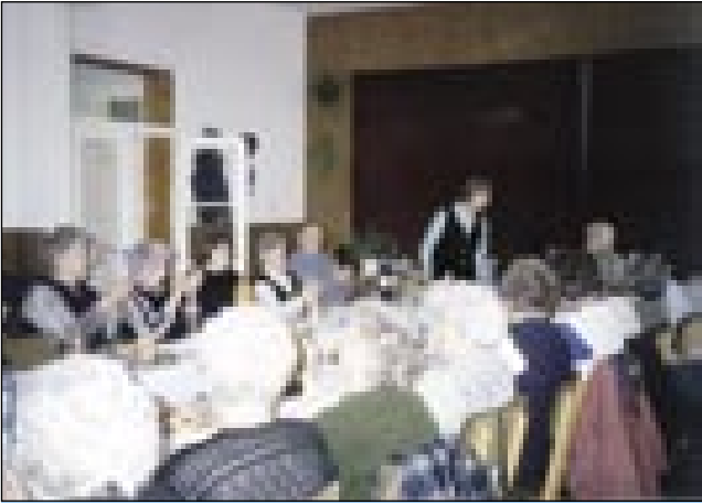
Člani kluba smo radi vküper, ne glede na tau, če smo Slovenci, Nemci ali Madžari

Znano je, ka na Dolenjom Seniki živejo tri narodnosti, Slovenci, Nemci in Madžari. V našom klubu se ne pozna, šteri je Slovenec,