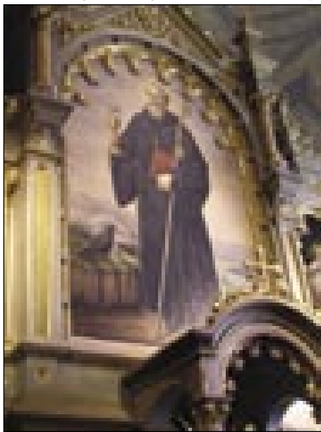
Glavni oltar s kejpom patrona sv. Benedikta v kančevskoj/bedeničkoj cerkvi

Po prvom spominanji je ešče važno tisto iz 1340, ka tuj pravi o Sv. Bedeniki . Kaže pa na tau, ka je šlo za trno staro, bar v romanskomi stili vö napravleno cerkev. Nej smo glij gvüšni, kak je vö vidla v 14. veki (gotika), pa kak so jo ešče kesnej prezidavali; samo po guči opata Kazoja v vizitaciji iz 1698 smeimo postaviti, ka je bila stara pa ka so jo od inda šteli za katoliško zgradbo ( ab antiquis catholicis aedificata ). V tom časi, tau se pravi od ranoga 17. veka naprej, pa ešče