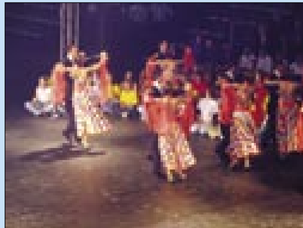
Plesci iz svetašnjoga programa

Sombotelški župan je pozdravo navzoče – posebej predsednika vlade in ženske. Ferenc Gyurcsány je biu eške minister za šport, gda je 2003. leta v Somboteli odo in dojdjau fundamentni kamen