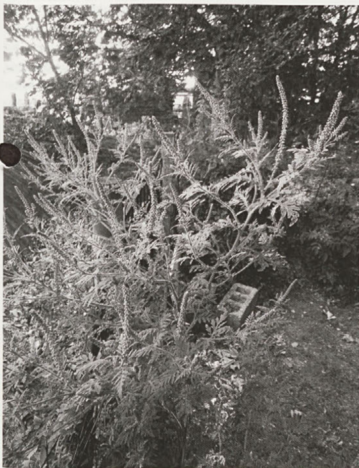
Ambrozija za rast izkoristi vsak »nered« v okolju.

KAM Z ODSTRANJE-NIM MATERIALOM Necvetoče rastline odložimo