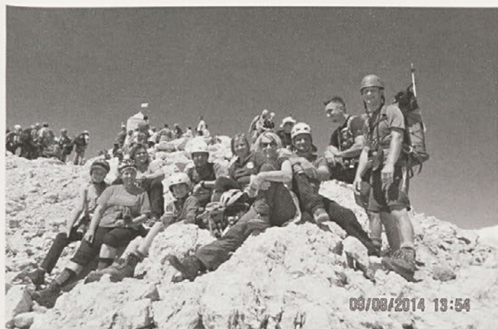
Še spomin z vrha Triglava