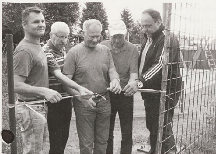
Svečani trenutek odprtja ruskega kegljišča

V športnem parku Tržec je bila 11. julija svečana otvoritev ruskega kegljišča, precej pomembne pridobitve za domačine in mnoge navdušence tega športa.