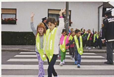
Naučili so se tudi, kako varno prečkati prehod za pešce.