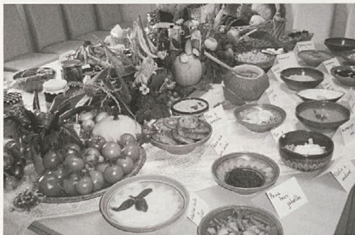
Miza se je šibila od dobrot.