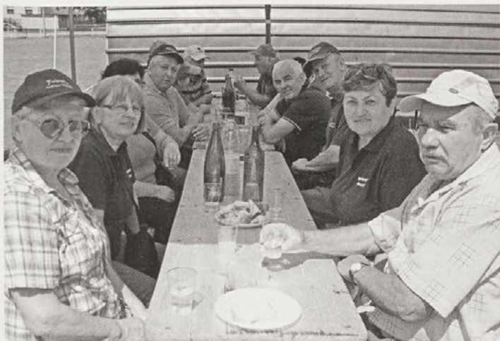
Člani DU Videm po končanem tekmovanju v rekreativnih igrah v Leskovcu

v Jurovcih. V začetku avgusta so organizirali kopalni dan v termah Mala Nedelja. Tudi tu ni manjkalo dobre volje in prijetnega druženja.