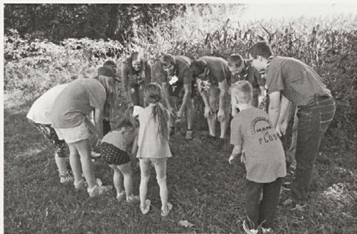
Na srečanju gasilske mladine so sodelovali tudi skavti iz Maribora.