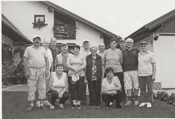
Kolesarski postanek pri Hliševih v Tržcu

Do zaključka tega leta nas čaka še nekaj aktivnosti. Spoštovani naši člani, članice,