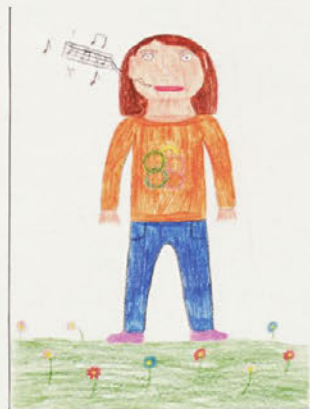
UČENKA POJE, GAJA ŽELEZNIK, 5. R OŠ SELA