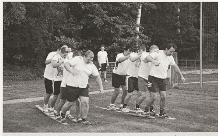
Zanimivo je bilo tudi v zabavnem delu, kjer so se nekateri preizkusili tudi v teku na smučeh.