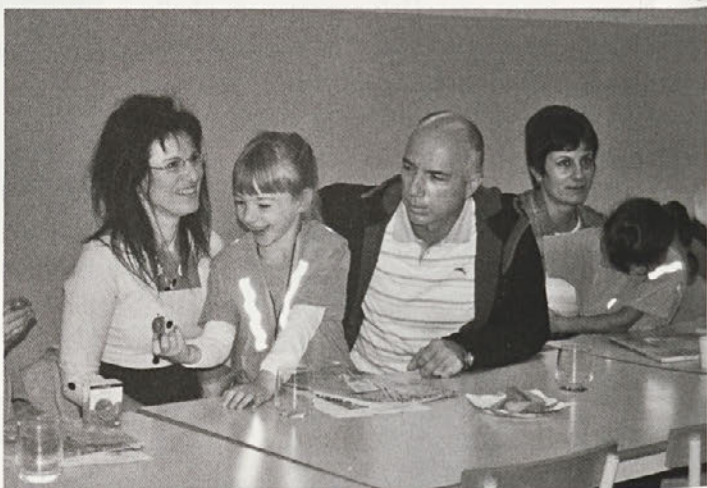
Danes je srečen dan ...