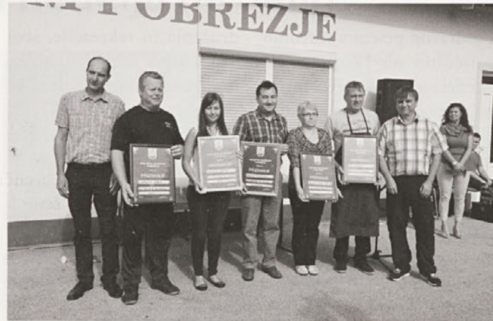
Dobitniki priznanj na prazniku KS Pobrežje