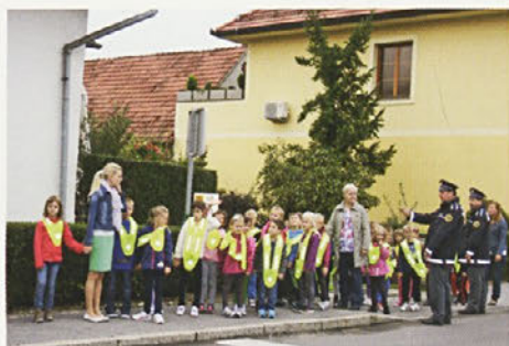
Z rumenimi ruticami so bili videmski prvošolci še bolj opazni ...