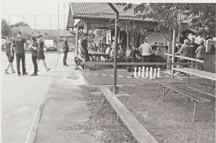
Ob sredah je kegljišče še posebej polno, saj tam potekajo redni treningi.