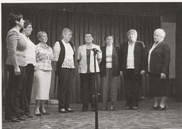
Na odru so zapele tudi pevke ljudskih pesmi FD Lancova vas.