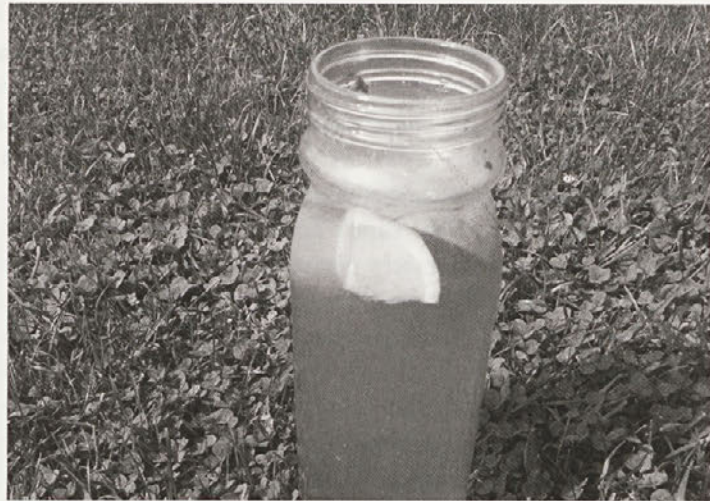
Osvežujoč vitaminski napitek za boljšo odpornost

Recept za pripravo vitaminskega napitka: v liter vode