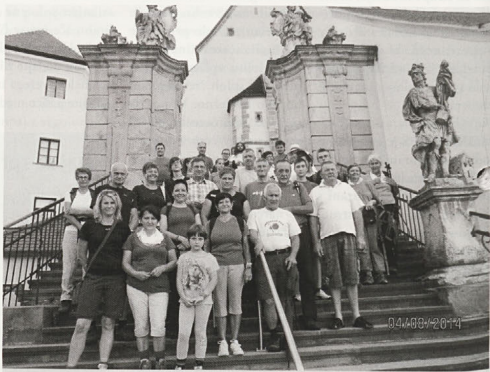
Štirideset romarjev se je 4. avgusta s Ptujске Gore podalo na dolgo pot.

K ar 40 romarjev se je 4. avgusta podalo na tradicionalni pohod s Ptujске Gore na Svete gore. Najstarejši romar je bil star več kot 70 let, najmlajše romarice okrog 12 let, trije romarji pa smo bili iz PD Haloze. Ob 17. uri smo se zbrali na Ptujски Gori, kjer smo opravili vpis in blagoslov za varno pot. Malo pred 18. uro smo se odpravili izpred bazilike Marije Zave- tnice in se podali na 54 km dolgo pot v smer Majšperka, mimo doline Winet- tu v Stopercah, pot nadaljevali proti Rogaški Slatini do Pristave pri Mestinju in nadaljevali v smeri Podčetrtek, Ime- na in Bistrice ob Sotli, naš končni cilj so bile Svete gore. Ves čas hoje nas je spremljal gasilski avto, kjer smo lahko puščali vso odvečno prtljago. Nekoliko večji počitek smo imeli v Rogaški Slatini in Podčetrtek, kjer smo se okrepčali in malo spočili. V Podčetrtek nas je začel spremljati duhovnik in med potjo smo molili rožni venec. Naše utrujene noge se kar niso mogle ustaviti našemu cilju naproti – Svetogorski Mariji, ki nas je pričakala v jutranjih urah. Približno ob 6. uri zjutraj nam je uspelo priti na cilj. Romarji smo naši Svetogorski Mari-