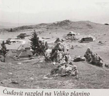
Čudovit razgled na Veliko planino