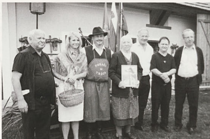
Zahvala tistim, ki so veliko doprinesli, da je križ dobil novi prostor na Djočanovi domačiji.