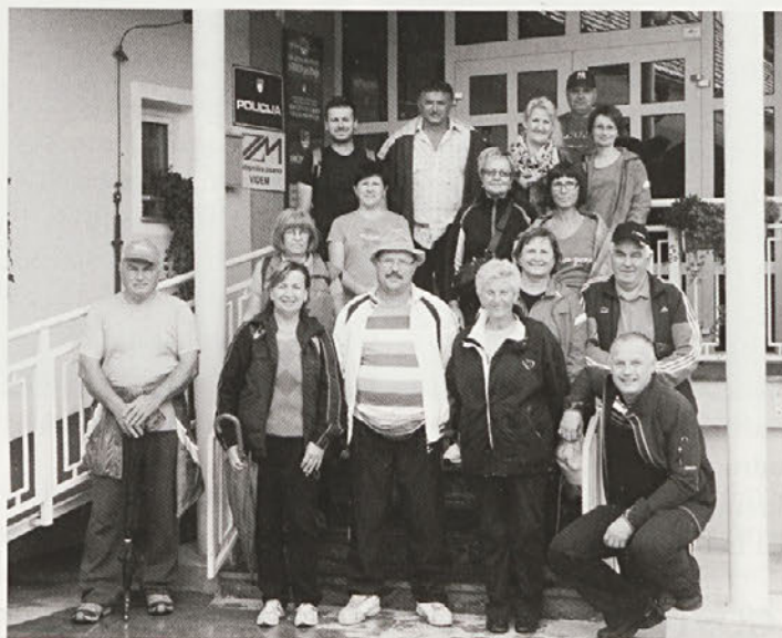
Videmski pohodniki so se 7. septembra odpravili na tradicionalni pohod po snemalnih poteh filma Svet na Kajžarju.