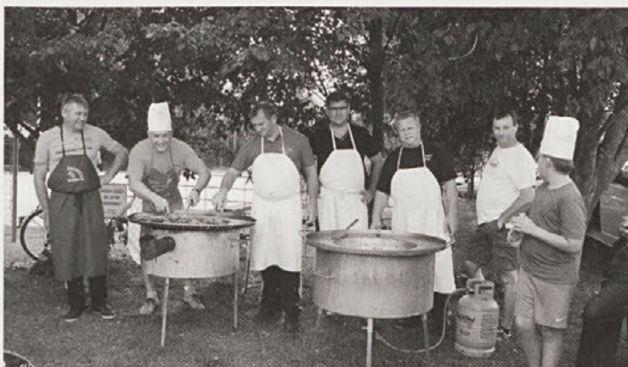
Kuharski mojstri so poskrbeli za odlično hrano.