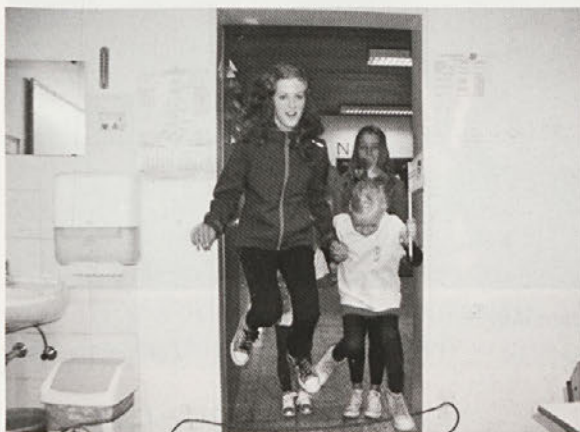
Skok v prvi razred