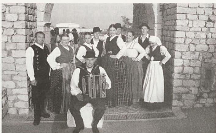
Na festivalu šokola v Ninu