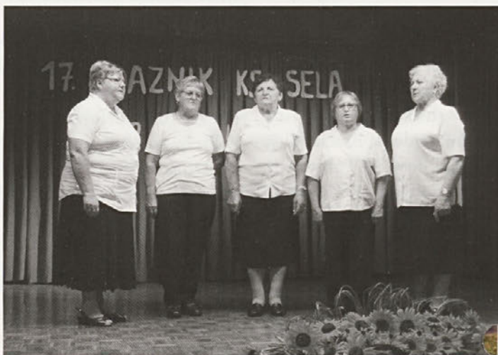
17. prazniku KS Sela so v pozdrav doživeto zapele tudi domačinke, pevke ljudskih pesmi KD Sela.