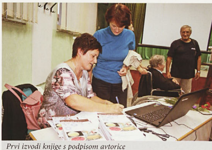
Prvi izvodi knjige s podpisom avtorice