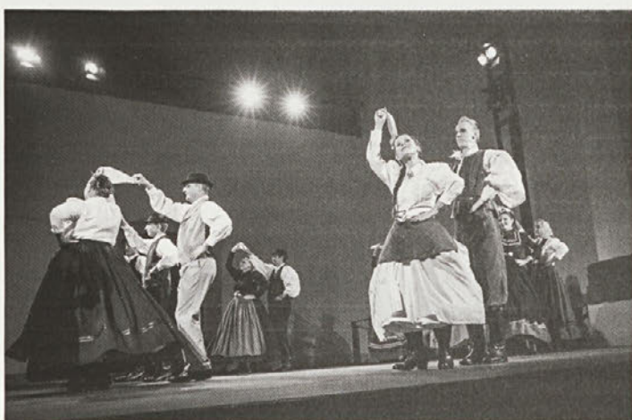
Plesalci na odru dominikanskega samostana

Cirkovce in vsem drugim, ki so kakor koli pripomogli k ugledni predstavi. Tovrstnih projektov, pravijo, bi morali narediti še več. V našem društvu se nikakor ni bati za podobne projekte.