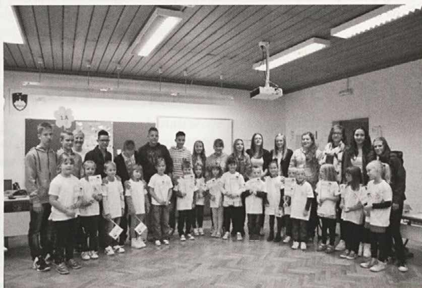
Videmske prvošolce so na prvi šolski dan v šolo pospremili njihovi varuhi iz devetega razreda. Na posnetku prvošolci 1. a.