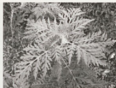
Ambrozija pred cvetenjem

Najučinkovitejša obramba pred negativnimi vplivi pelinolistne ambrozije je odstranitev rastline iz okolja in preprečitev širjenja na območja, kjer še ne raste. Ambrozija se zatira/odstranjuje tudi z večkratno košnjo ali z mulče-