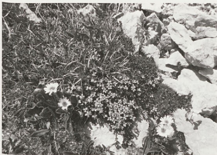
Planinsko cvetje ob poti