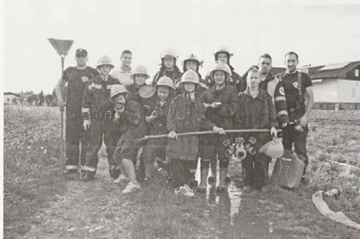
Mladi gasilci PGD Sela so tudi v praksi preizkusili, kako poteka pravo gašenje travniškega požara.

V petek in soboto, 29. in 30. avgusta, so mentorji mladine v PGD Sela za svoje mlade gasilce pripravili prvi tabor gasilske mladine. Po uspešnem sodelovanju v kvizu gasilske mladine gre za naslednjo izmed dejavnosti, ki jih selski gasilci vključujejo v delo z mladimi. Mentorji so bili več kot zadovoljni z udeležbo. Pričakovano število 10 otrok na taboru je bilo namreč skoraj podvojeno – tabora se je udeležilo kar 17 otrok.