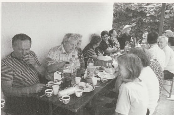
Ob kegljišču se videmski upokojeanci zdaj še bolj pogosto dobivajo.

Šestnajst najbolj spretnih se je odpravilo s kolesom na pot po domači in sosednji kidričevski občini, 15. julija pa jih je doma čakalo manjše slavlje ob odprtju ruskega kegljišča, ki so ga selski upokojeanci sami izgradili pri športnem