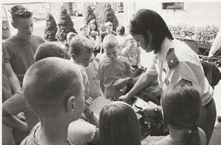
Otroci so si z veseljem ogledali tudi predstavitev dela policistov iz PP Podlehnik.

ne, kako lahko človek preživi v naravi skoraj brez kakršnih koli pripomočkov, čebelarji pa zanimivo življenje čebel. Zraven teh dveh delavnic so otroci spoznavali še značilnosti in postopke gašenja požarov v naravi, četrta točka pa je bila namenjena raznim igram, v katerih so otroci pokazali svoje motorične spretnosti.