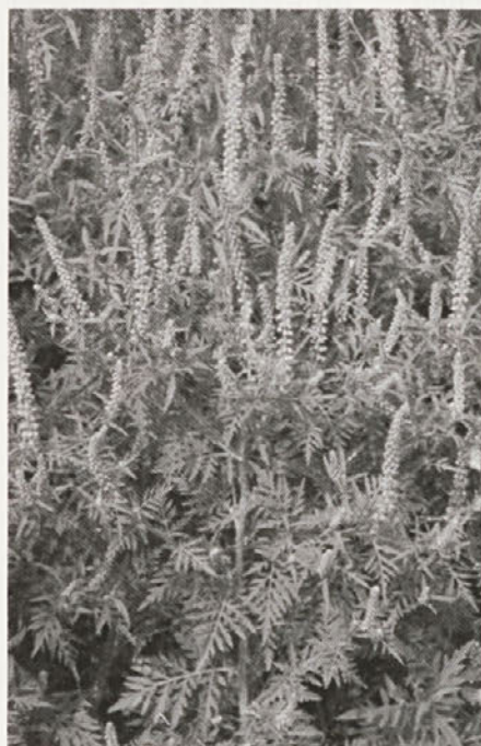
Ambrozija v času cvetenja