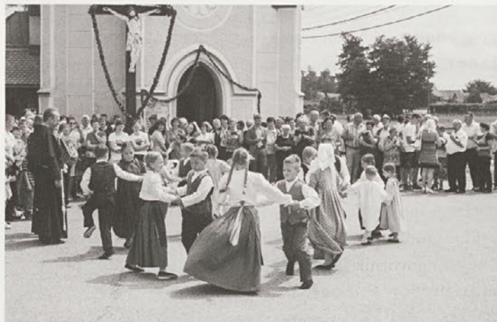
Po končani maši so med slavljem pred cerkvijo v programu nastopili tudi najmlajši folklorniki FD Lancova vas.