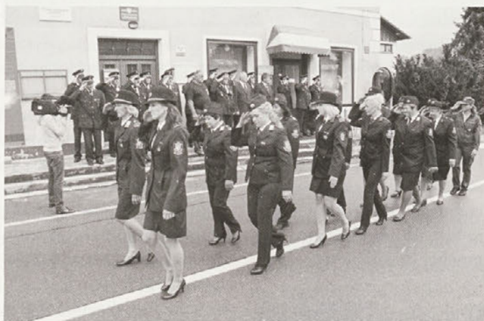
Slovesnost v Leskovcu so začeli z gasilsko parado, v kateri so sodelovali uniformirani gasilci vseh društev v gasilski zvezi Videm in gostje.