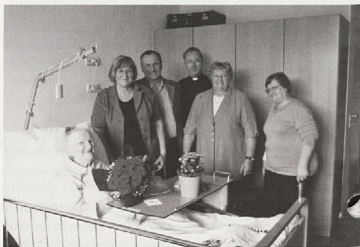
Na obisku pri slavljenki sestri Honorino v Gradcu