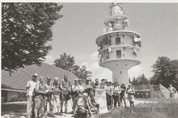
Prijetno je bilo tudi na Trdinovem vrhu.