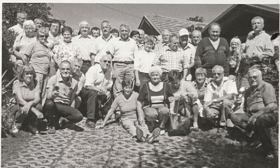
Utrinek z izleta na Razkrižje

čije Horvat. Po enournem ogledu in pripovedi mojstra Horvata o delovanju kovačije treh generacij smo se podali v sosednjo vas Šafarsko in si ogledali