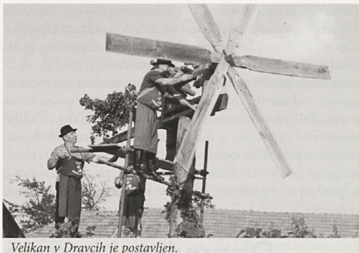
Velikan v Dravcih je postavljen.