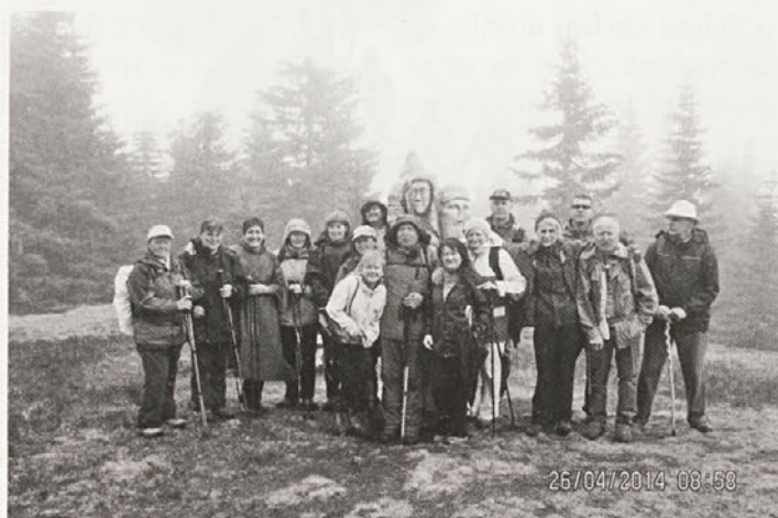
Planinci na Košenjaku v Avstriji

Maja, na praznik dela, smo se podali na Peco (2125 m) – na Kordeževo glavo. Izpred parkirišča Jakobe smo se podali proti vrhu, ki je bil sicer malce zasnežen, a je ponudil prekrasen razgled. Ozrli smo se lahko na sosednjo Olševo in Raduho. Obiskali smo tudi votlino kralja Matjaža, ki se vedno čaka na svojo Alenčico.