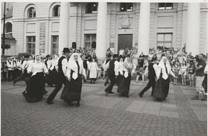
Utrinek z nastopa lancovovaških folklornikov pred občino v Lublinu na Poljskem