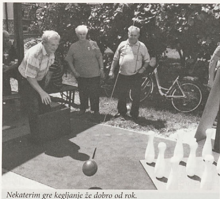
Nekaterim gre kegljanje že dobro od rok.