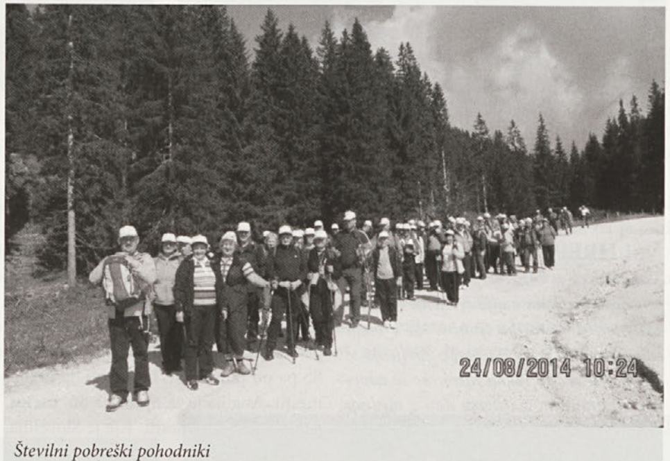
Številni pobreški pohodniki

Muhasto vreme, ki mu letos ni konca, jim je načrtovani izlet 25. junija preprečilo. Pohod so morali preložiti. Pravšnje vreme so ujeli v avgustovski soboti. Prvič so se številni Pobrežani in njihovi prijatelji odpravili v planine. Ob prijetnem vzdušju in dobri postrežbi na avtobusih so za kratek čas pozabili na vsakodnevne skrbi, ki jih v današnjem času nikomur ne manjka. Udeleženci so bili različnih generacij, vendar so pot zmogli prav vsi. Pred napornim vzpo-