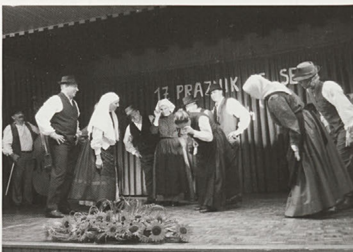
Kulturni program so na slovesnosti s spletom Ječmenček obogatili tudi sosedge – plesalci odrasle FS FD Lancova vas.

Osrednjo praznično slovesnost na Selih so obogatili: pevci mešanega cerkvenega pevskega zbora sv. Družine, pevke ljudskih pesmi KD Sela ter pevke ljudskih pesmi, muzikanti in odrasla FS FD Lancova vas.