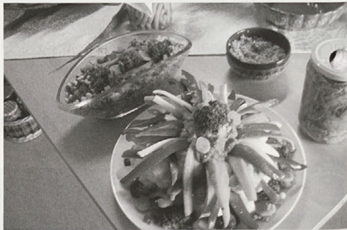
Cvetača v razcvetu