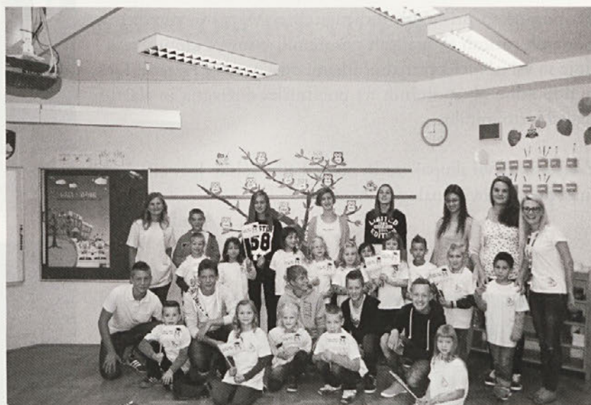
Varuhi s prvošolci iz 1. b