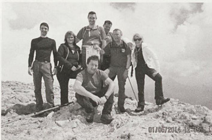
Na praznik dela so se povzpeli na Peco.