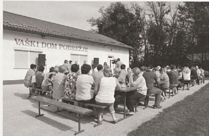
Tudi na letošnji praznični prireditvi se je zbralo lepo število Pobrežanov.