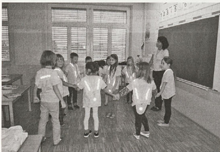
Na prvi šolski dan so v razredu tudi zaplesali.