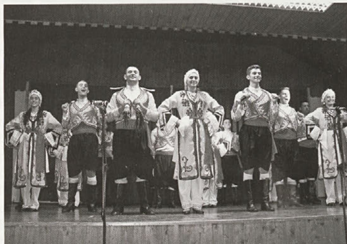
Nastop gostujoče FS mladinskega centra Inonu s severnega Cipra je pritegnil pozornost številnih obiskovalcev, ki so napolnili dvorano kulturne dvorane na Selih.