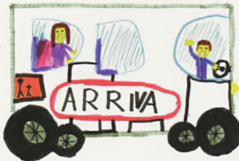
PIA NARAT, 5. R OŠ SELA