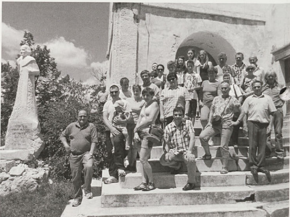
Zbrani pred cerkvijo Svetogorske Matere Božje