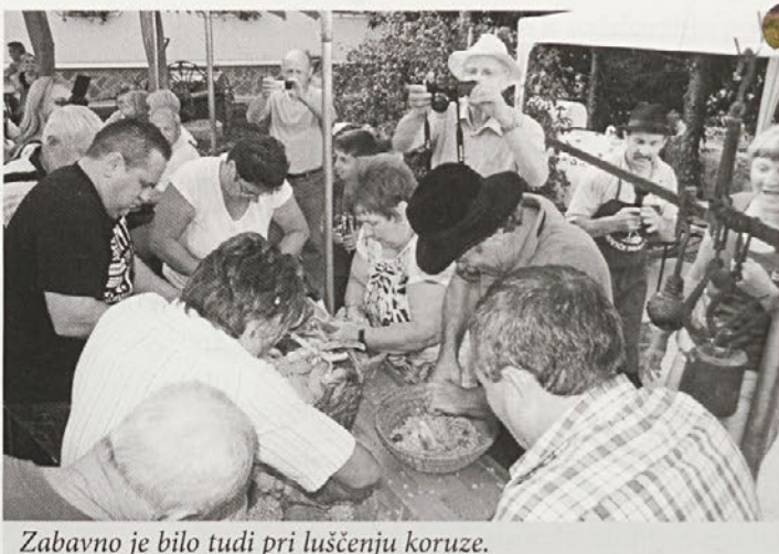
Zabavno je bilo tudi pri luščenju koruze.