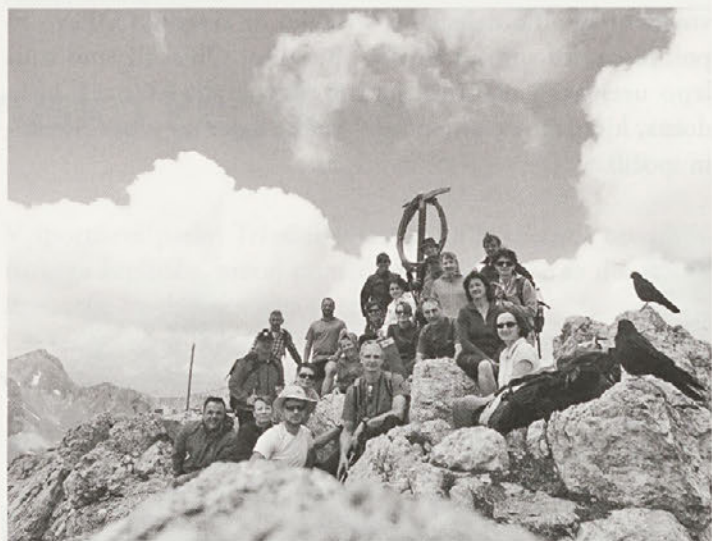
Na vrhu Vrtače (2181 m)