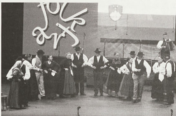
Rožmarinovci na velikem odru Folkarta