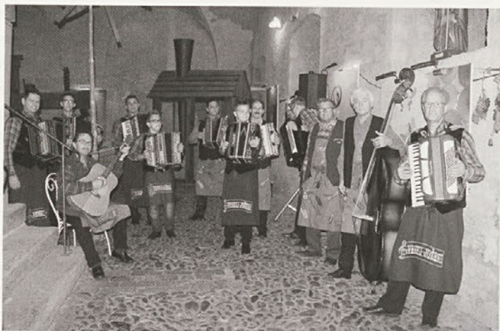
Veseli Jožeki in Ljudski godci iz Vidma so nastopili v ptujski grajski vinski kleti na zaključku letnega projekta LQ.