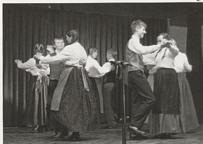
Obiskovalce je navdušila tudi starejša otroška FS FD Lancova vas s spletom Kovač je začēja.