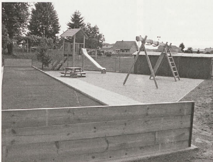
Nova otroška igrala in steza za balinanje sta prav tako novi pridobitvi v športnem parku.