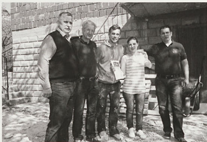
Mladi družini v Brezovcu pri Cirkulanah so Veseli Jožeki podarili skromen prispevek za obnovo hiše.

Po nekaj mesecih je družina s pomočjo Centra energetskih rešitev, Zveze prijateljev mladine in dobrih ljudi obnovila svoj novi dom, kamor so se v tem času gotovo že preselili. Haloze so mladi družini