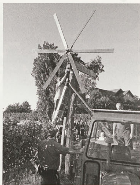
Po Majskem Vrhu že odmeva Gregorečev velikana in vabi na bližnjo trgatvev.

Po uspešno opravljenem delu so nas ponovno pričakale obložene mize, ki so se šibile od dobrot. Ob zvokih harmonike Branka Kranjca smo praznovali