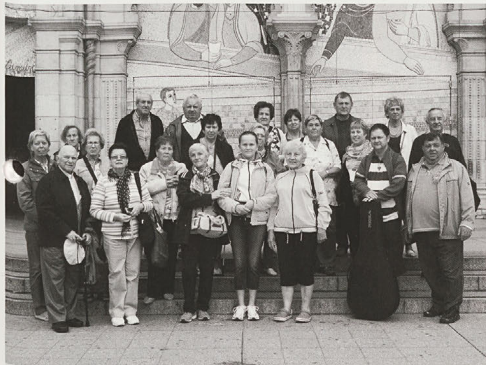
Skupina slovenskih romarjev letos avgusta v Lurdu