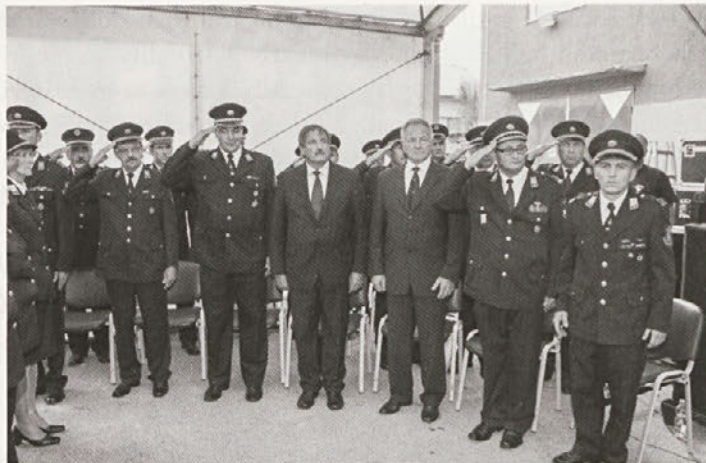
Na prazniku gasilcev GZ Videm so se zbrali številni gostje, tudi iz sosednje Hrvaške, kar gre pripisati dobrim prijateljskim odnosom med gasilci.