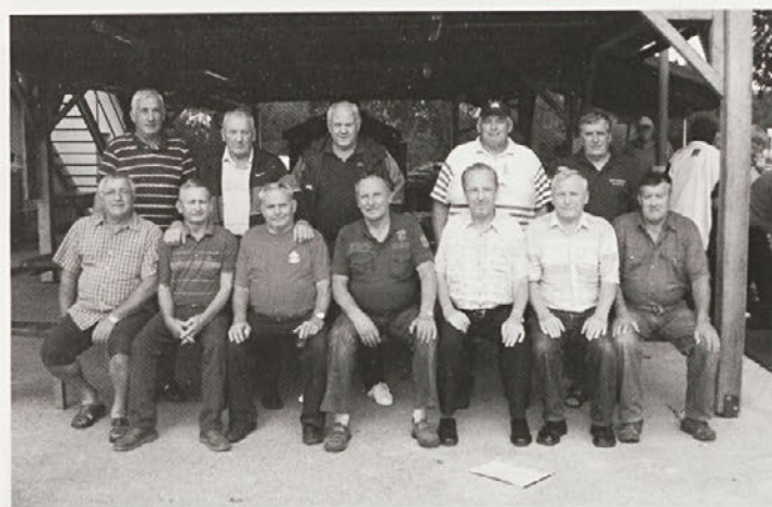
Srečanje v športnem parku Tržec. Na posnetku ekipi kegljačev DU Videm in DU Sela.

vabim vas, da se jih udeležite v čim večjem številu, dokler nam zdravje še služi.