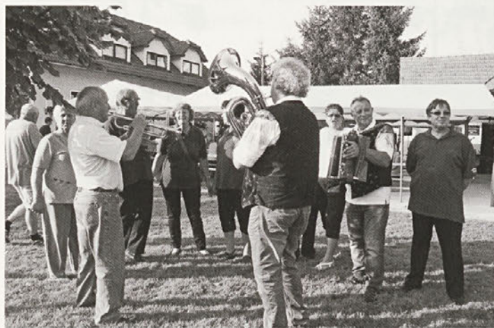
V Halozah veselja in pesmi pri postavljanju klopotca ni zmanjkalo.

slišala še pozno v noč. Ko sta bila oba velikana postavljena, so domačini simbolno naznanili prihajajočo jesen in trgatve, veselja in