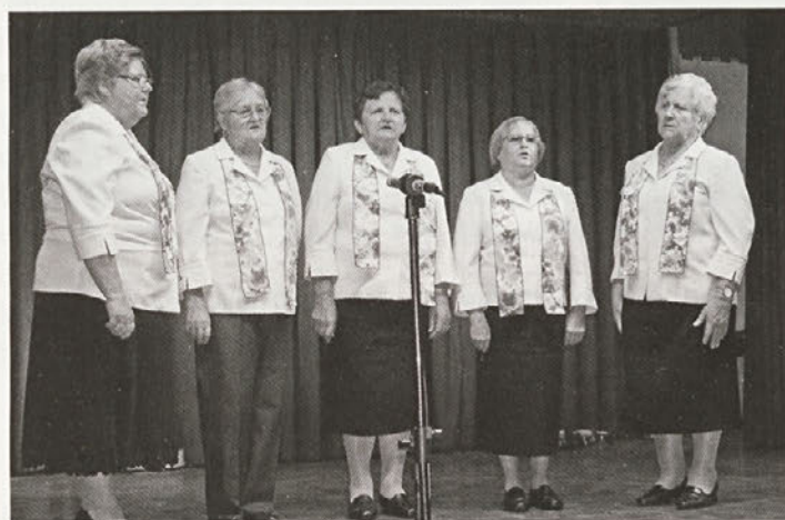
Z ljudsko pesmijo so se na domačem odru predstavile tudi pevke ljudskih pesmi KD Sela.

predstavil občino ter nekaj njenih zanimivosti in posebnosti, zvečer pa so predstavili še na prireditvi na Selih.