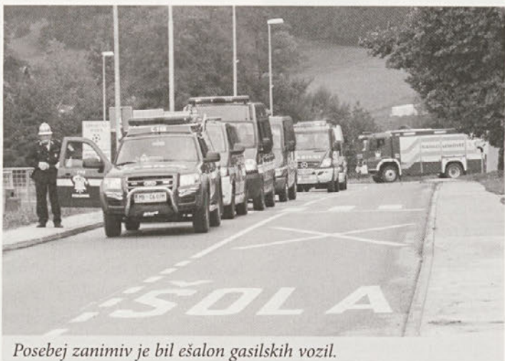
Posebej zanimiv je bil ešalon gasilskih vozil.

usposabljanja, ki se izvaja na Igu, v regiji in naših društvih. Zelo uspešno sodelujemo z občinami, s katerimi smo podpisali akte o izvajanju lokalne javne službe, sprejeto imamo kategorizacijo gasilskih društev ter pridobivamo potrebna sredstva za izvajanje nalog požarnega varstva. Praznik dneva gasilcev nosi v sebi moto dela v celotnem letu in trenutek, ko se ustavimo, da bi proslavili in nazdravili doseženemu, da bi okolje opozorili na naše delo, ki ni samo sebi namen, ampak je usmerjeno predvsem k občanom, da