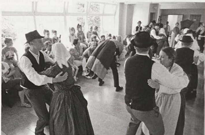
Lepi spomini ostajajo na letošnje gostovanje na Poljskem, še posebej na nastop v otroški kliniki v Lublinu, ko so s plesom in petjem razveselili številne otroke.