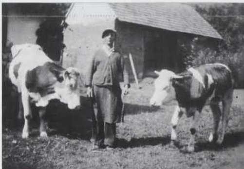
Konje je vōmejno na krave

omanca polejvala, ka je ženska že v slednjom cajti bila. Komaj, ka sam se ge do Reština nazaj pripelo, sestra je že valas prinesla, ka se je dejte že naraudilo. Vala Baugi, zato se mi je en nej po pauti naraudo, če rejsan enparkrat sila bila.“