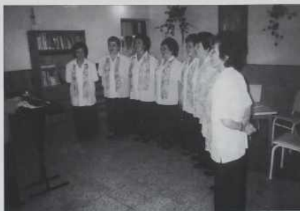
Domanje ljudske pevke

Šest igralcov, pet žensk pa eden moški se je na „oder“ postavio. Publika je zadovolna bila, na konci so je nej pūstili doj, tak fejst so ploskali. Vūpam, nedo čemerni, če tau napišem, ka so Števanovčani nej vsigdar dobra publika. Liki na te den so pa ja vōdjali zase. Telko lūdi pa