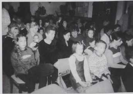
Prišli so stari pa mladi