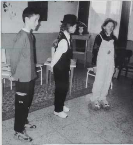
Šaularge števanovske šaule

Tak februara se je zgodilo, ka so me iz Števanovec iskali. Voditeljica kulturnoga dauima mi je povedala, da so se najšli v vesi