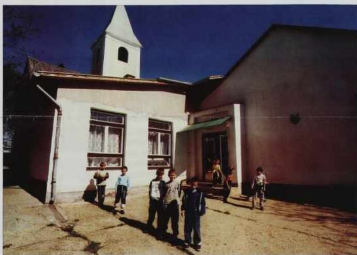
Porabske šole se zaradi nizkega števila učencev ubadajo z velikimi finančnimi težavami.

Mešana komisija bo ocenila, kako se uresničujejo določila Sporazuma in priporočila zadnjega zasedanja komisije, ki je bilo leta 2000 v Ljubljani. V tem obdobju je bilo uresničenih nekaj pomembnih sklepov in priporočil. Podpisan je nov Sporazum o prosvetno-kulturnem sodelovanju med državama in v tem okviru razrešen status obeh svetovalcev za slovenski jezik na narodnostnih šolah v Porabju in za madžarski jezik na dvojezičnih šolah v Prekmurju. Kulturni dom v Lendavi je v zaključni fazi in bo v letu 2001 predvidoma dokončan, Sloven-