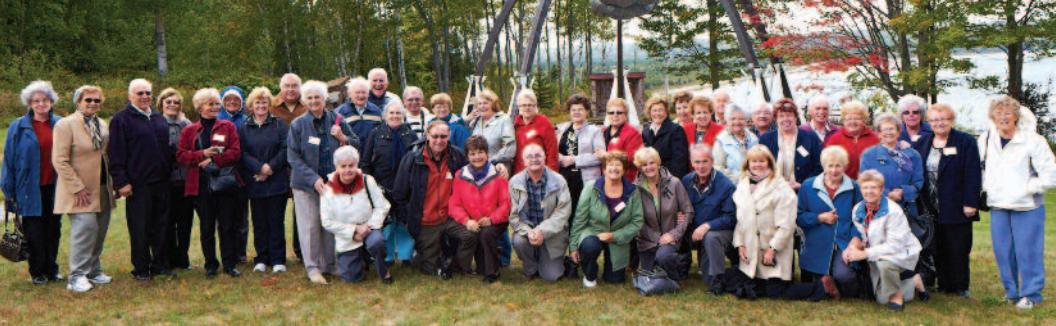
Zgoraj: romarji Hamiltonskega avtobusa. Spodaj: romarji Torontskega avtobusa