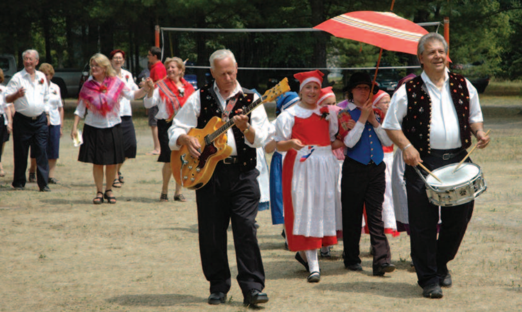
Na Slovenskem dnevu v Montrealu