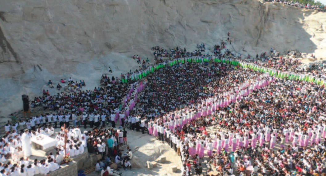
Sveta maša na kamnolomu, na praznik vseh svetih, 1. novembra 2012

začeli zvoniti. Telefoni so pričeli delovati; vsi so sporočali, da poteka napad na mesto Akamasoa.