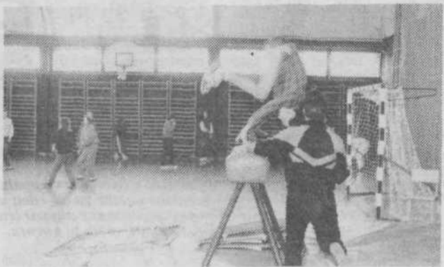
Sodobna telovadnica: v šoli si je ob intelektualnem delu treba tudi razgibati telo.