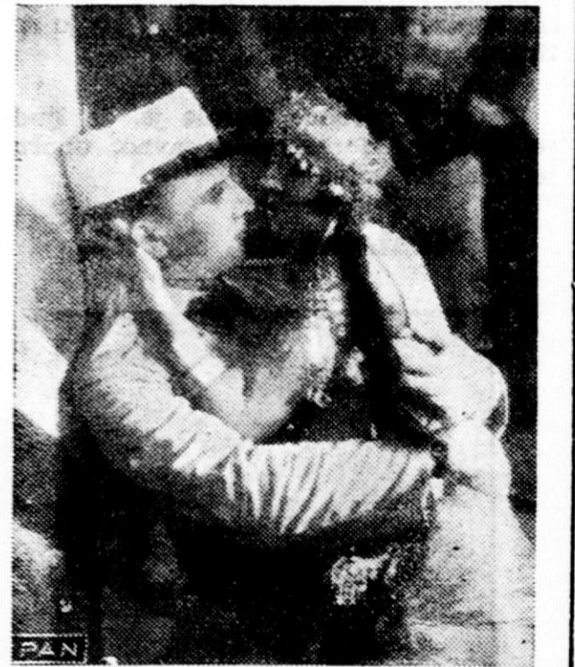
Prizor iz filma »Seržant Xc«, ki v njem igra glavno vlogo Možuhin