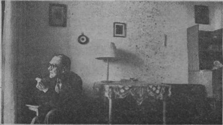
Najlaže je premišljevat v miru