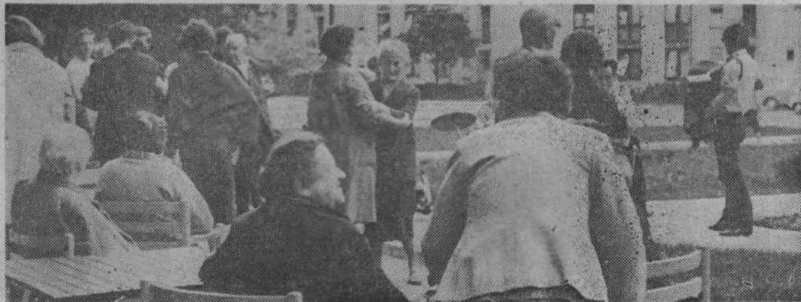
Gibanje na svežem zraku res ni napačno