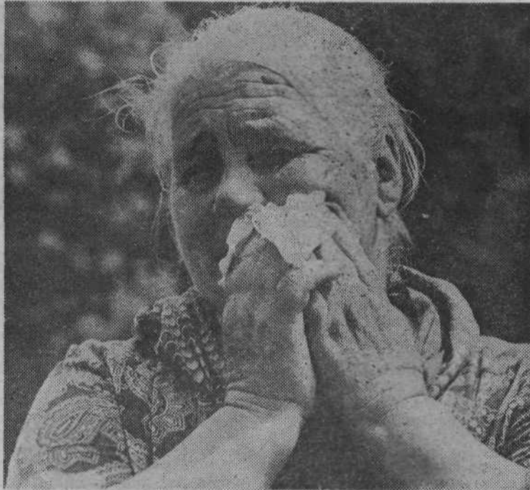
Lepo, da ste me prišli obiskat