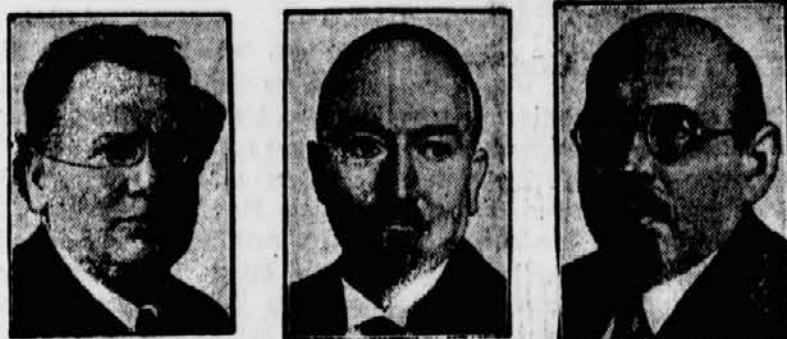
Gerüchte über einen Wechsel russischer Diplomaten

berichten, daß der Volkskommissar für Auswärtige Angelegenheiten, Tschitschew (Mitte), aus Gesundheitsrücksichten zurücktreten wird und durch den jetzigen Sowjetbotschafter in Berlin, Krestinski (rechts) ersetzt werden soll, während für den Berliner Botschafterposten der jetzige Vertreter Tschitschew, Litwinow (links), ausersel-