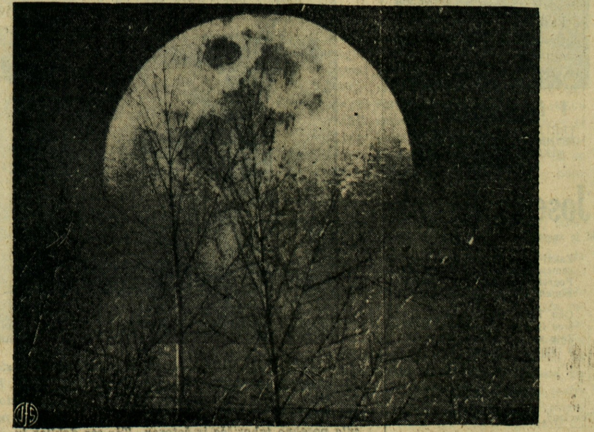
LUNA VZHAJA — Howard Potter je s posebno kamero skozi teleskop posnel tole fotografijo vzhajajoče lune v Schenectady, N. Y.