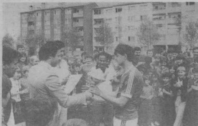
Prehodni pokal na turnirju v malem nogometu je zaslužen osovjoila ekipa Sing-Sing (na sliki), v košarki pa ekipa Bratov Tuma.