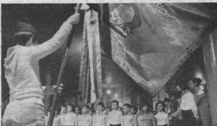
Cicibani so postali pionirji. Tako je bilo te dni na vseh šolah v naši občini in trenutki sprejema so bili povsod nadvse slovesni.

aktivnosti za večje uveljavljanje delegatskega in skupščinskega sistema, ki je bil sprejet na 4. seji OK SZDL 26. junija letos. Nadalje, da bodo usmerjeni k najvažnejšim življenjskim vprašanjem delov-