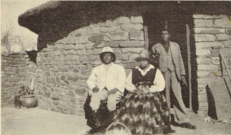
Sekutuni II., der Großhau- ptling der Bapedi, mit Tochter. Im Hintergrund des Fürsten Sekretär.

beamten am Komatifuß spazieren, um Flußpferde zu Gesicht zu bekommen. Ein Neger, der des Weges kam, erriet bald unsere Absicht und lud uns ein, ihm zu folgen; er kenne beliebte Aufenthaltsorte dieser Tiere. Und tatsächlich, an einer sehr tiefen Stelle des Flusses sahen wir plötzlich Wasser aufspritzen; es kam ein großer Kopf zum Vorschein. Um ihn anzulocken, schwenkte der Schwarze ein rotes Tuch in der Luft. Da erschien ein zweiter Kopf über der Wasserfläche, ein dritter, ein vierter und schließlich noch zwei kleinere. Unter heftigem Geschnauze und Gepuste schwammen die Ungeheuer auf uns zu, bis wir sie in nächster Nähe in ihrer ganzen Größe sehen konnten. Dann machten sie kehrt und schwammen dem andern Ufer zu. Durch die vielen Jagden, die man früher auf Nilpferde machte, wurden sie stark dezimiert, weshalb nun die Regierung verboten hat, sie zu schießen.