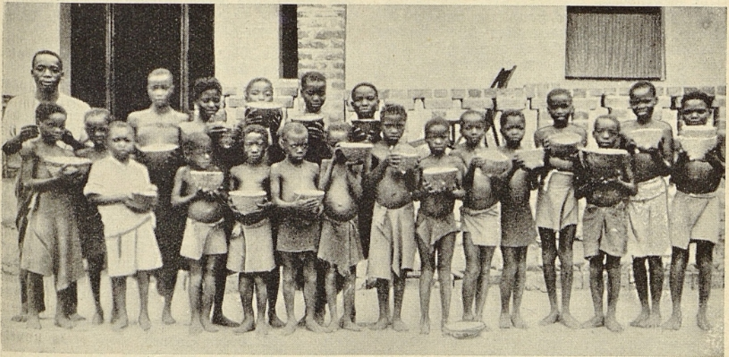
Missionssonntag in einer „Büchschule“. — Die Kinder des Urwalds aus der Heilig-Geist-Mission Nord-Katanga in Belgisch-Kongo bringen ihre Gaben für das Werk der Glaubensverbreitung. Die Körbchen enthalten Maniokmehl und kleine Fische. Erzbischof Dellepiane, der Apostolische Delegat des Kongogebietes, berichtet, daß das Werk der Glaubensverbreitung in vielen Kongomissionen eingeführt ist. Die Einheimischen halten darauf, auch ihren Teil beizutragen, selbst wenn dieser oft nur in einem Korb mit Lebensmitteln besteht.

Der älteste Sohn jeder weiteren Lapa erbt den dazugehörigen Besitz wie auch das Vieh, das durch Verheiratung seiner eigenen Schwestern hereinkam. Es besteht die Bodi-Redensart, daß eine Lapa nicht eine andere Lapa aufessen könne. Wenn daher beim Tode des Familienhauptes eine Lapa einer anderen verhil-