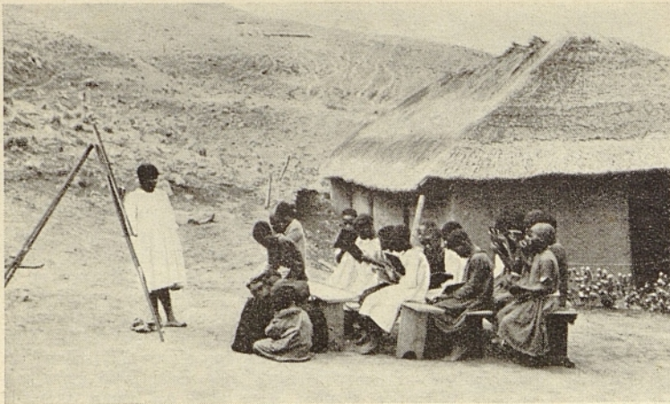
Einheimische Lehrerin beim Unterricht, der, soweit möglich, im Freien gehalten wird.

det ist, so muß der Erbe der verschuldeten Lapa die Schuld abtragen. Handelt es sich dabei um eine Viehschuld und ist kein Vieh vorhanden, um die Forderung zu erfüllen, so muß die Sache in der Schwebe bleiben, bis eine Tochter der betreffenden Lapa heiratet. Alsdann muß das für sie bezahlte Vieh zur Schuldentilgung verwendet werden. Es geschieht nicht selten, daß der Familienwater Vieh, das zu einer gewissen Lapa gehört, benutzt, um eine Frau zu erwerben zur Gründung einer weiteren Lapa. Wenn nun bei seinem Tode das Vieh nicht an die Lapa zurückgegangen ist, von der es genommen wurde, so hat der Erbe der verschuldeten Lapa die Sache so bald als möglich ins reine zu bringen.