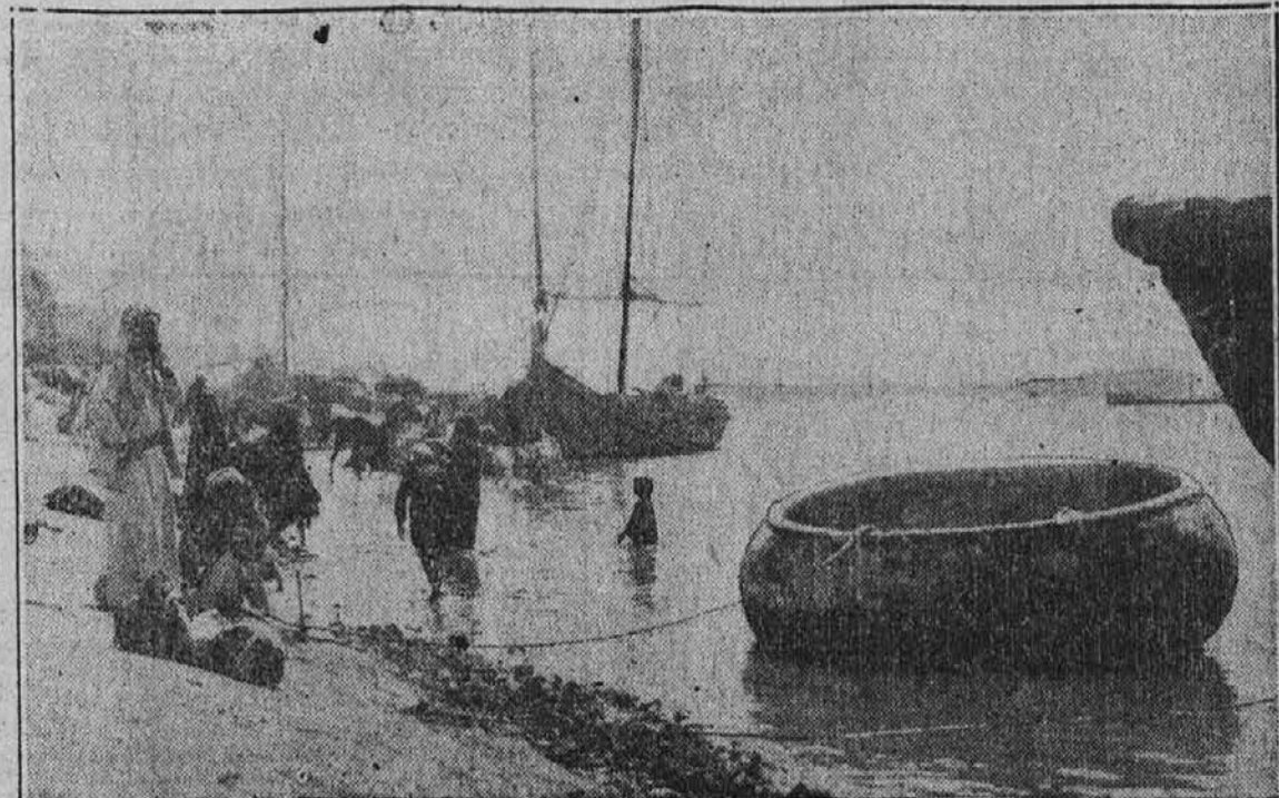
Gornja slika je bila vzeta v Bagdadu, v prestolnici države Irak, in sicer ob reki Tigris. Kakor po mnogih drugih krajih sveta je vojna razburkala tudi tukaj mirno življenje prebivalstva. Ljudstvo tukaj živi še po starodavnih običajih in moderna zapadna civilizacija še ni dosti prodrla do njega. Tako vidimo v ospredju okrogel pleteni čoln, o katerem se trdi, da je tak kot tisti, v katerem je bil Mojzes odložen v reko Nil.