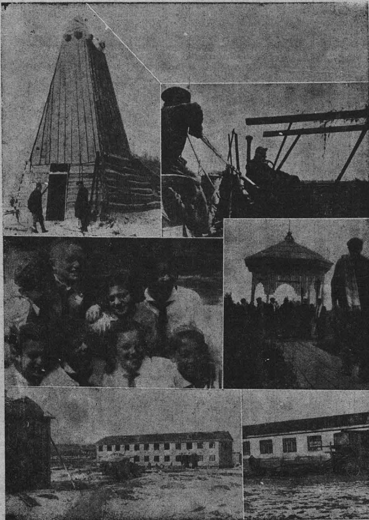
Napredek sovjetske Rusije v Sibirskih pustinjah

"Jaz tudi nisem vedela, kaj je to", meni druga, "do dneva, ko sem srečala moškega, ki me je napravil nesrečno..."