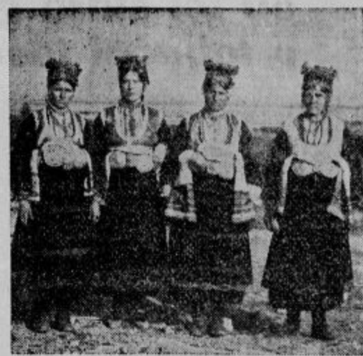
Žene — rusalijke iz Mirovča pri Gjevgljeliji

Mislimo, da ne gre tako naglo razpisavati volitve, od javnega razglasa pa do volitev je vmes komaj 3 dni. Poleg tega pa stojimo na načelnem stališču, da je trška imovina, katero upravlja trški odbor, lastnina le posestnikov, in sicer ne samo litijskega trga, ampak tudi krajev St. Jurij, Veliki Vrh in Grbin, ker vsi ti kraji so od nekdanj spadalni skupaj in na pravico posestnikov teh krajev se glase tudi gotove trške pravice, kot dohodki sejmov itd. Zato seveda ne gre, da bi o teh posebnih pravicah, katere so svojočasno pridobili posestniki teh krajev, odločevali volilci, ki se nahajajo v Litiji le prehodno, in