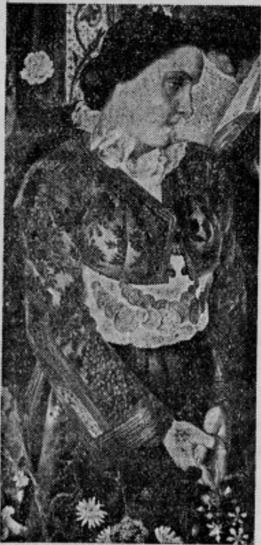
Iz triptihona »Svetovna vojna«: Srbinja

Blizu Konjice si je na prijaznem malem posestvu uredil svojo delavnico akademični slikar Matej Koelz. Iz njegovega pripovedovanja posnemamo, da je bil rojen kot sin trgovca 31. marca 1895 v kraju Mühlendorf na