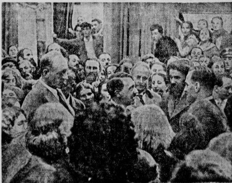
Mož ki se mu pokori in mu je vdana vsa Nemčija, med oberammergauskimi izralci.

Paul Poiret — mednarodno znani pariški modni umetnik, ki je v zadnjem času popolnoma obubožal. Njegovi ateljeji so brez vseh naročil in Poiret brez sredstev. Kosit hodi v ljudsko kuhinjo za obubožane duševne delavce. Dobiva tudi majhno podporo za brezposelne.