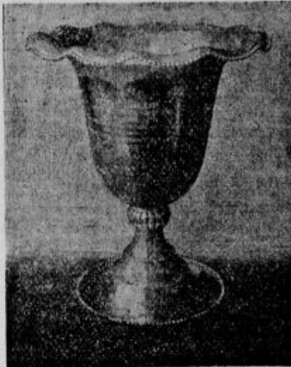
Evropska kupa — nagrada za magdeburške zmagovalce.

Človek tudi višje leta kot ptič: višinski rekord za letala znaša 13.600 m, kondor pa, ki med ptiči najvišje leta, doseže komaj višino 5500 m.