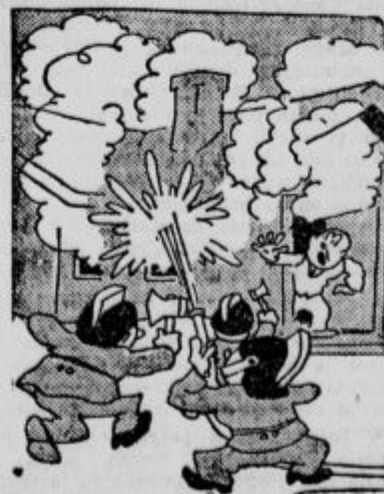
»Halo, za božjo voljo nehajte — saj se je samo moji ženi orizgal jajčni kolač!«