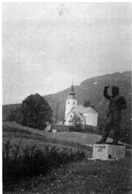
Po slikarju, doma iz Sorice, nosi kolonija svoje ime

Marsikateremu sprehajalcu je tisto sončno sobotno dopoldne zastal korak, ko je na svoji poti srečeval učence, opremljene s papirji, barvami in čopiči ali fotoografskimi aparati. Množica mladih slikarjev in fotoamaterjev je bila za večino Ločanov uganka. Le od kod med mladino tolikšno navdušenje za slikanje? Bi bil slikar iz Sorice vesel, če bi jih videl? Prav gotovo!