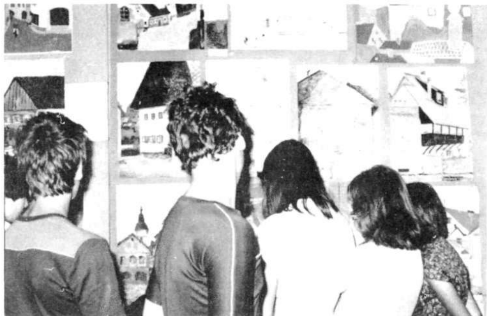
Razstava v galeriji na Loškem gradu

– Bitole v Makedoniji. Med udeleženci je bil tudi učenec iz Celovca.