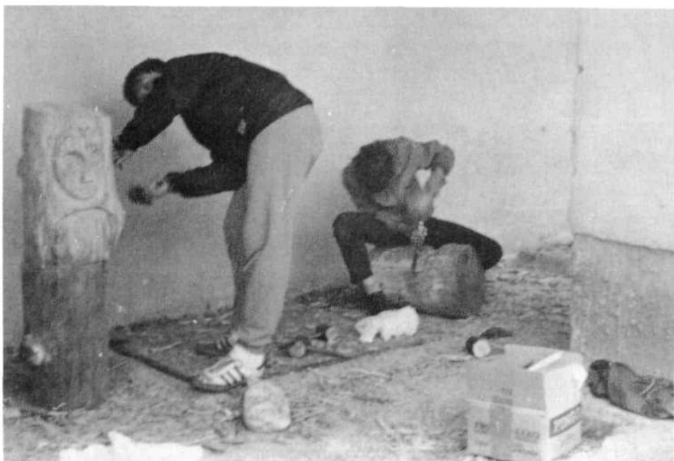
Mlada kiparja pri delu