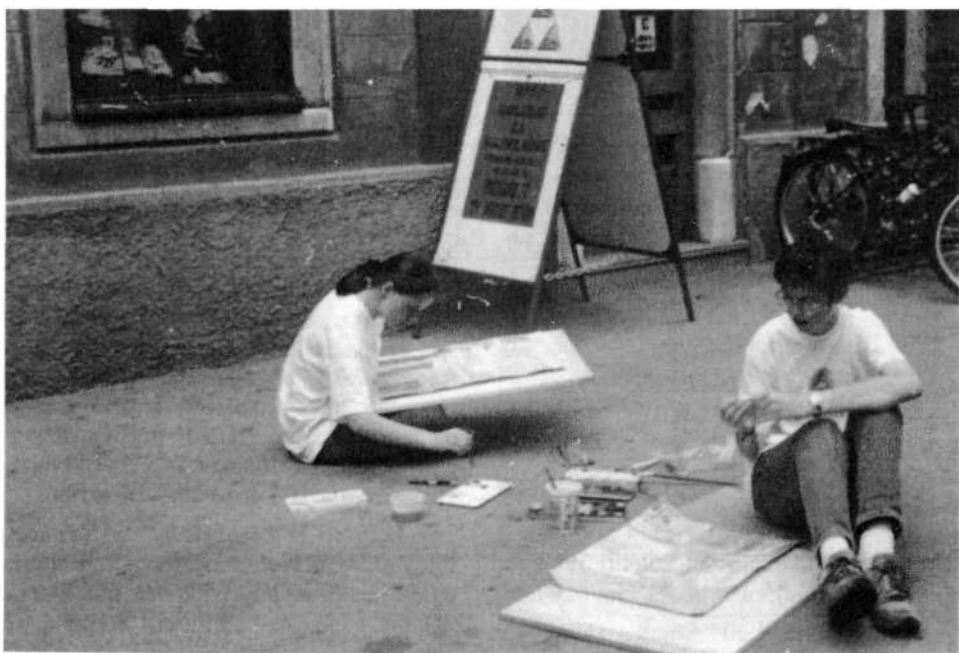
Na Mestnem trgu...