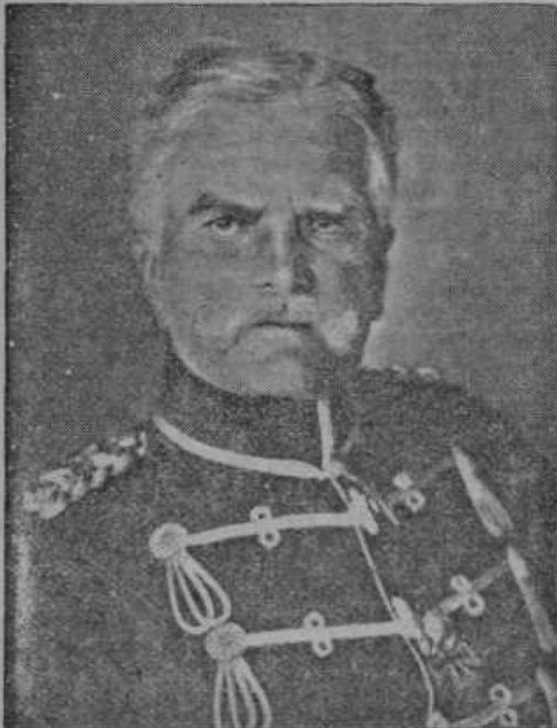
Avst. ... general iz svetovne vojne, je dopolnil 91 let

Otok Malta je kamniten in nerodovit. Ker je bilo pomanjkanje rodovitne zemlje že v zgodnjem srednjem veku opazno, je morala sleherna ladja, ki je priplula k Malti, pripeljati s seboj tovor dobre črne zemlje. Vendar zavisi Malta glede na najvažnejša živila povsem od uvoza iz drugih pokrajin. Breme vojne brez dvoma prav hudo tlači Maltežane, zakaj pred to vojno so italijanska pristanišča uporabljali za uvoz in izvoz. Proga z Malte do italijanske Sicilije je dolga le 60 milj, v Aleksandrijo pa 900 milj! Daljša pot brez dvoma podraži uvožene in izvožene proizvode. Ne-