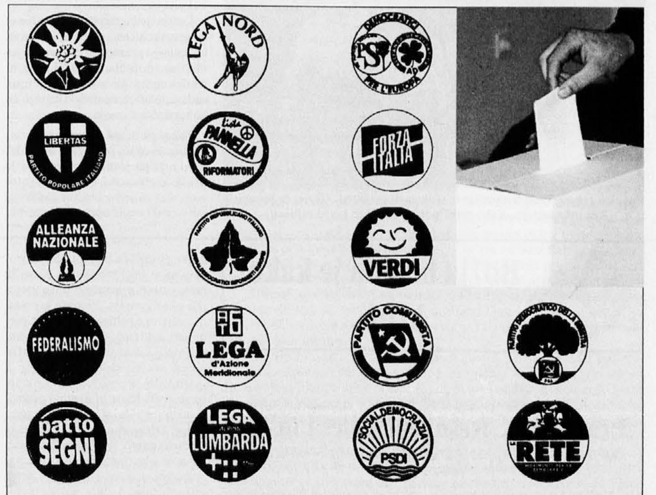
Simboli, ki jih bomo našli na glasovnicah za evropski parlament. Slovenska skupnost nastopa na listi manjšinskih strank Federalizem.