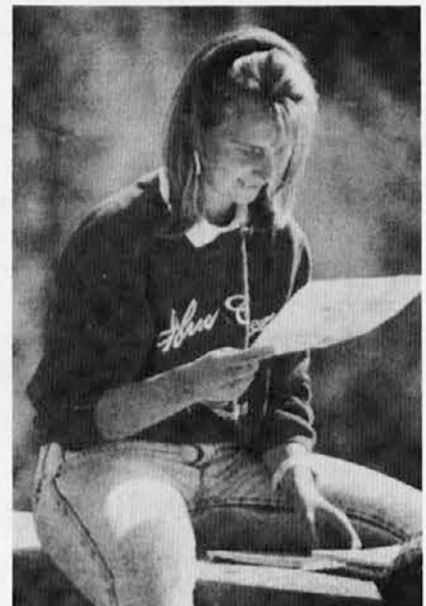
Veliko mladih je pripravljenih sodelovati. Znajmo se jim približati...