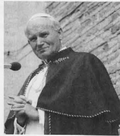
ležen močnega objema z Gosopodom.

Te misli so sad velike molitve sv. očeta, molitve, ki se je rodila iz trpljenja, v katerem je bil papež de-