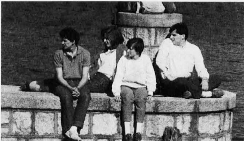
Pogosto nekateri mladi naredijo iz svojega doma hotel. Gorje, če jim starši kaj pripomnejo. Kako najti pot za izhod iz teh skrajnosti?