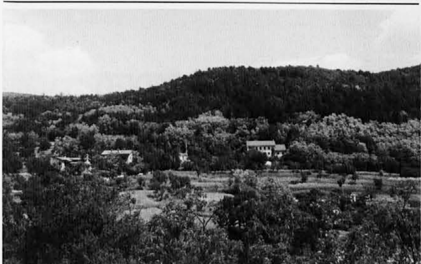
Počitniška kolonija bo od 5. do 25. julija v Dragi pri Trstu. Tam je velika stavba vsa v zelenju, oddaljena od cest, v miru. Tu se lahko otroci veliko igrajo in tekmujejo. Tu se lahko naužijejo tudi čistega zraka.