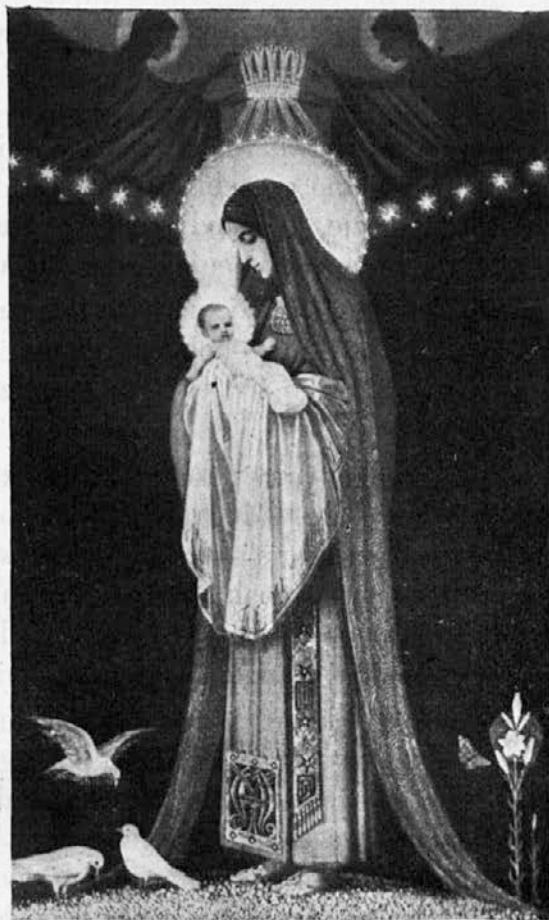
Majniški Kraljici slava!

slijo, je treba sedaj odločno in za nekaj let z obrestno mero navzdol, da se zacelijo rane, ki so jih denarni zavodi utrpeli, oziroma jih bodo utrpeli z odpisovanjem različnih svojih terjatev, nekaterih delno, nekaterih v celoti.