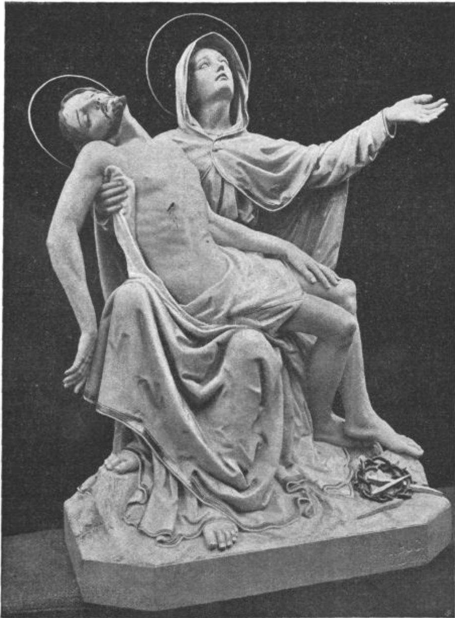
Žalostna Mati božja. (Kip Ivana Puca v Škofji Loki.)