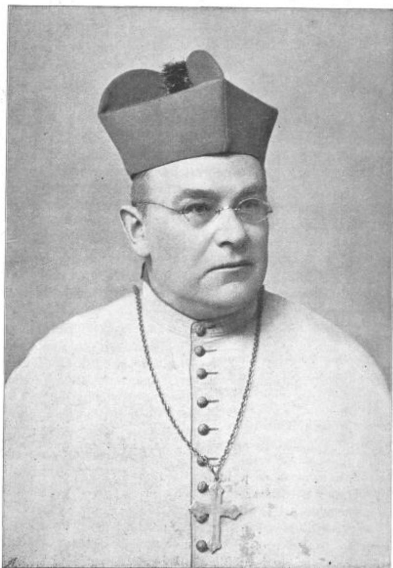
Knezonadškof goriški dr. Francišek Sedej.