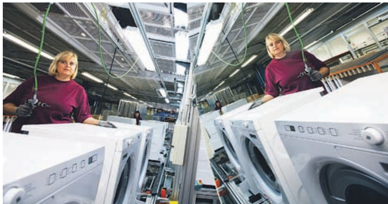
Svojo konkurenčno priložnost vidi Gorenje v prestižnih blagovnih znamkah Asko, Atag in Gorenje.

Uprava je prve ocene že predstavila nadzornemu svetu. Ta je ocenil, da se je Gorenje po nestabilnih makroekonomskih in političnih razmerah v začetku leta dobro odzvalo in se usmerilo na druga tržišča, na obstoječih pa kljub težavam okrepilo prodajo in tržne deleže. V zadnjem četrtletju so dosegli najvišjo prodajo in ustvarili dobiček. V osnovni dejavnosti aparatov za dom so ustvarili dobro milijardo evrov prihodkov, kar je več, kot so načrtovali. Na dobičkonosnost pa bodo vplivale tečajne razlike, ki jih bo po ocenah več, kot so načrtovali. Znašale naj bi okoli 12,6 milijona evrov, kar je za skoraj enkrat toliko, kot so računali. Na poslovanje je najugodnejše vplivalo zadnje četrtletje, ko so ustvarili tudi najvišji dobiček iz poslovanja