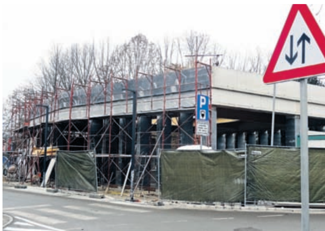
Dela pri gradnji tržnice za zdaj stojijo zaradi neugodnih vremenskih razmer.

bo imela pridobitev za kraj, pa je Kurnikova odgovorila: »Veliko, kajti naše poslanstvo je druženje, popestritev življenja v mestu. Tržnica bo nudila možnost druž-