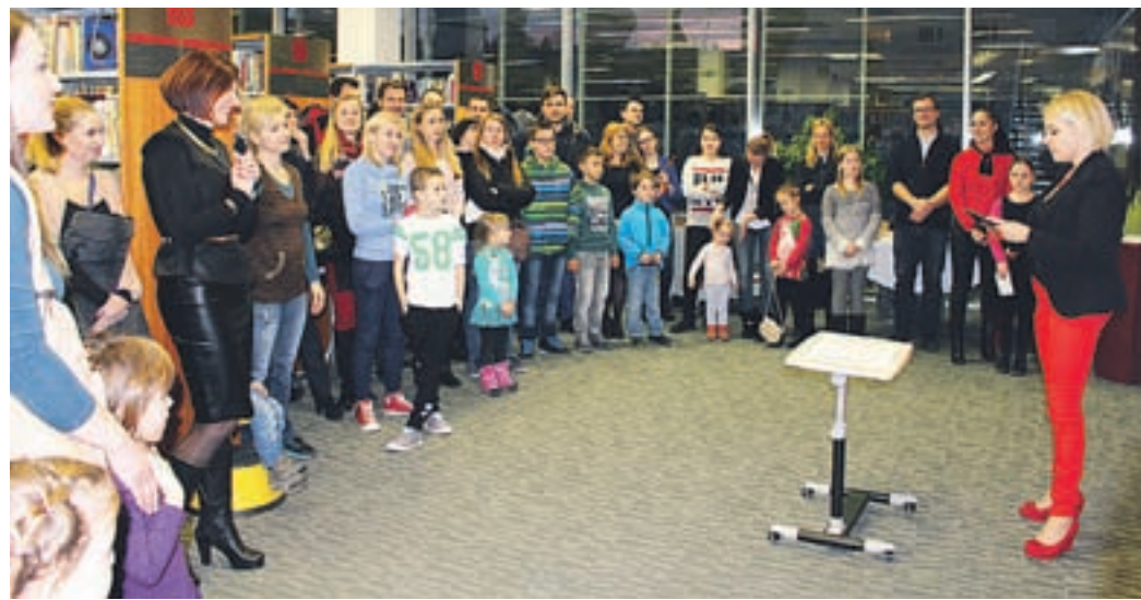
V ponedeljek, 25. januarja, pa je bila otvoritev razstave risbic otrok zaposlenih v Plastiki Skaza z naslovom Vračamo življenje plastiki. Otroci so ustvarjali na temo Vračamo življenje plastiki. Razstava je na ogled do 31. januarja na Sončni steni Knjižnice Velenje.