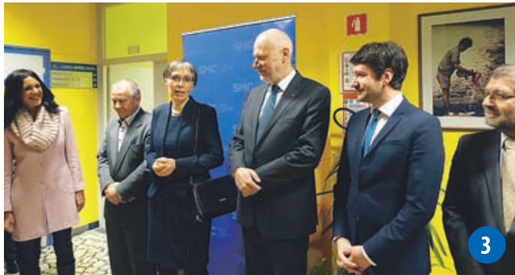
Med odprtjem poslanske pisarne v drugem nadstropju Ljudske univerze