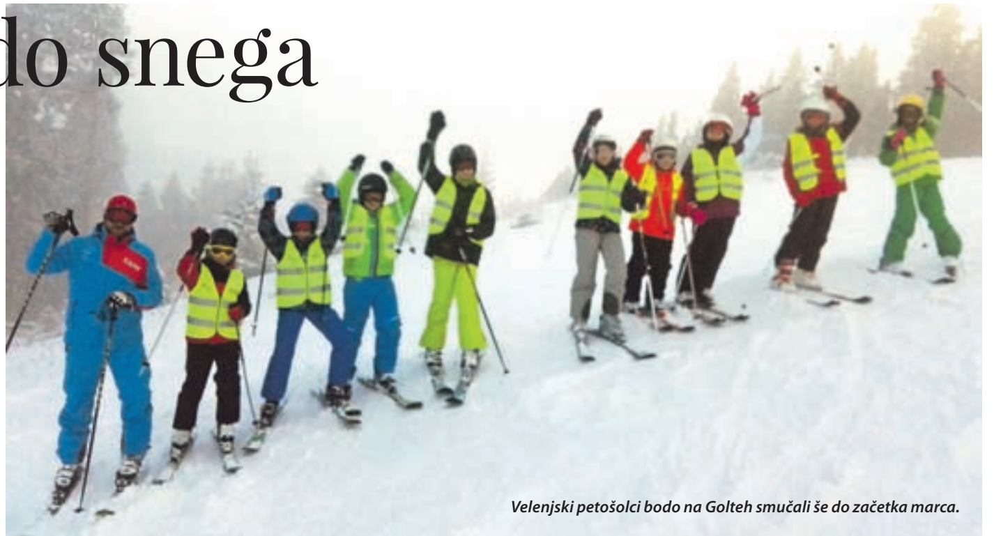
Velenjski petošolci bodo na Golteh smučali še do začetka marca.

nja na snegu ali telemarka logistično in finančno ne bi izšlo. »Gre za to, da otroci, ki še nikoli niso stali na smučeh, dobi priložnost, da spoznajo, kako prijetno je smučati. Potem pa se lahko kasneje v življenju odločajo za telemark, bordanje, freeri-