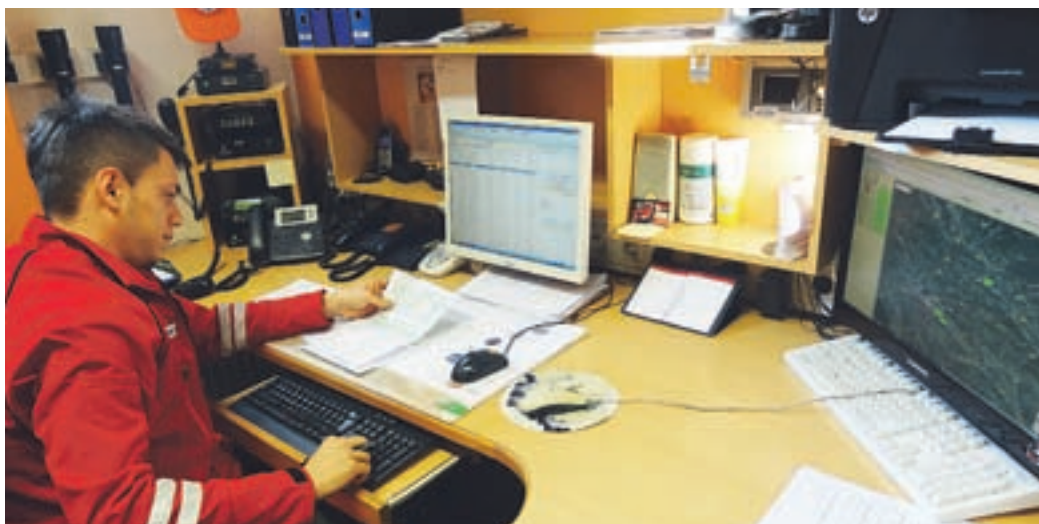
Prostor, v katerem koordinator sprejema klice in spremlja vozila na terenu